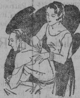
Artritis Dolorés de muñeca y brazos Dolorés de espalda y riñones

El LAPIZ TERMOSAN se vende en todas las Farmacias y Centros de Específicos Tubo grande; 4.45 ptas. - Tubo pequeño; 3.- ptas., timbres incluidos