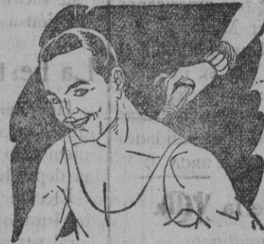
Rigidez del cuello Torticollis