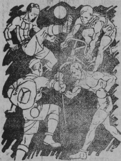
Indispensable para toda clase de sports. No ocupa sitio ni es frágil