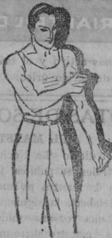
Fatiga muscular Golpes-Torceduras