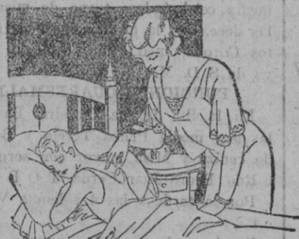
Resfriados - Asma - Pleuresias Congestión pulmonar