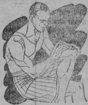
Reuma - Clática Golpes

Preparado en forma de una barrita de facilísimo empleo. Se aplica rápidamente tal como se presenta y sin tener que ensuciarse las manos.