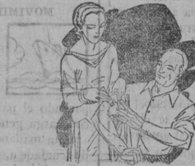
Dolor en las articulaciones Calambres

El LAPIZ TERMOSAN es el Revulsivo más práctico y eficaz contra toda clase de dolores y congestiones.