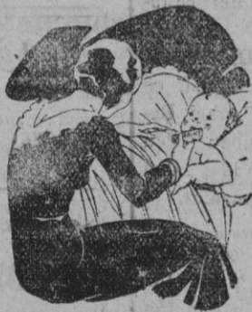
Tos - Catarros - Bronquitis Congestiones