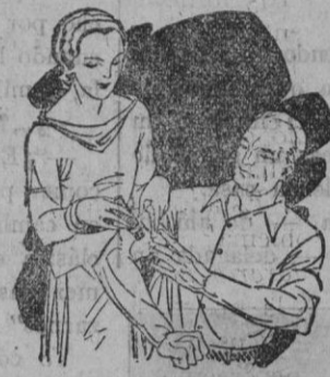
Dolor en las articulaciones Calambres

No ocupa sitio Desconggestionona sin irritar No ensucia No tiene mal olor