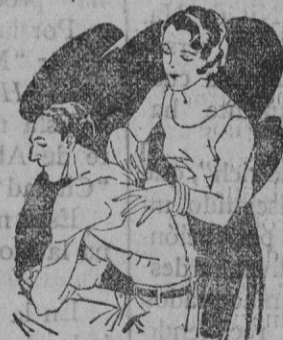
Artritis Dolor de muñeca y brazos Dolor de espalda y riñones

El LAPIZ TERMOSAN se vende en todas las Farmacias y Centros de Especificos Tubo grande; 4.45 ptas. - Tubo pequeño; 3. - ptas., timbres incluidos