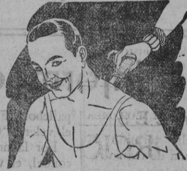
Rigidez del cuello Torticollis