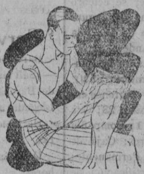
Reuma - Clónica Golpes

Preparado en forma de una barrita de facilísimo empleo. Se aplica rápidamente tal como se presenta y sin tener que ensuciar-se las manos.