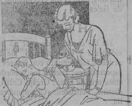
Resfriados - Asma - Pleuresias Congestión pulmonar