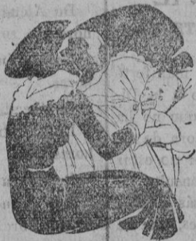
Tos - Catarros - Bronquitis Congestiones