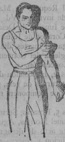
Fatiga muscular Golpes - Torceduras