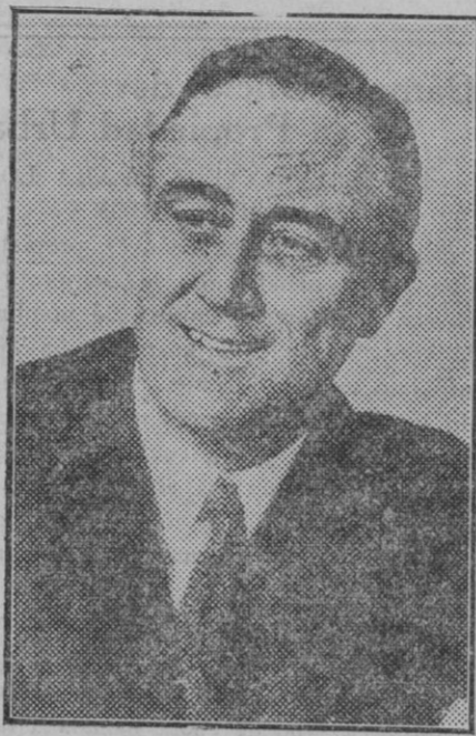
Miami (EE. UU.) — Mr. Franklin D. Roosevelt, Presidente electo de los Estados Unidos, que ha sido objeto de un atentado.

Que a tal extremo han llegado las cosas que no son excesivas ni aun suficientes, esas afirmaciones vagas y generales que a menudo encabezan los programas de los partidos españoles — religión, patria, propiedad, familia, ciencias liberales, principios democráticos, valores históricos... y que por su misma vaguedad y por su misma generalidad pueden sostenerse desde distintos