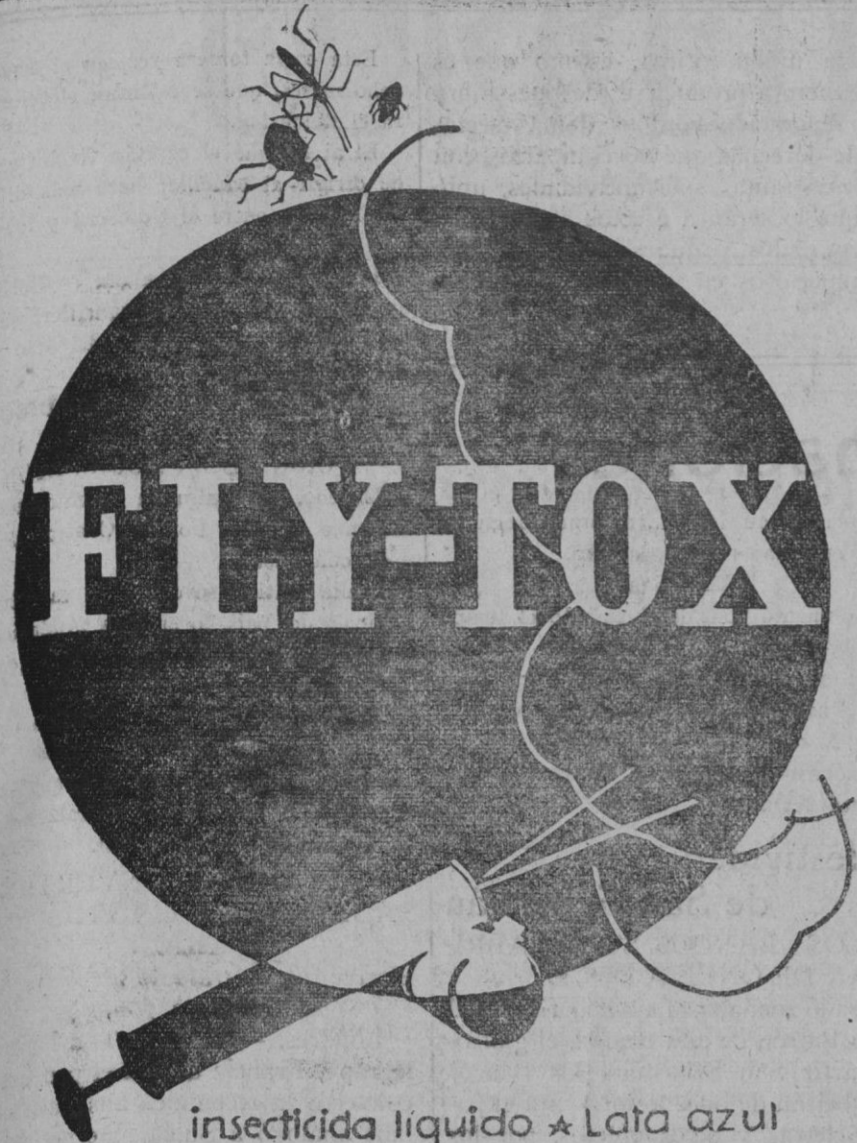
insecticida liquido * Lata azul

Se admiten esquelas mortuorias hasta las once de la mañana.