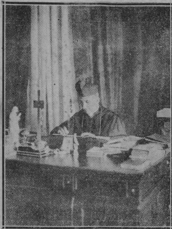
S. Excmo. Cardenal Lépicier, Prefecto de las Congregaciones Religiosas.

A la hora fijada se colocaron en la pista para correr la primera prueba, cuyo recorrido era de 2.850 metros, los siguientes caballos: