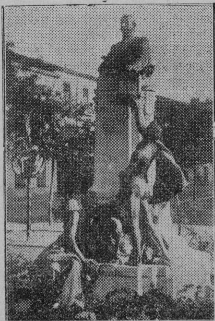
Guadalajara. — El monumento erigido al conde de Romanones el año 1913, que ha de ser trasladado a la Escuela Normal de Maestros de la provincia.

La gran pesta del temps modern és el "laïcisme", ha dit el Pontífic. El "laïcisme", qui nega l'imperi de Crist sobre totes les gents, qui nega la missió de l'Església catòlica intentant subjugarla, qui rebaixa la Religió cristiana al nivell de les religions falses, qui la vol substituir per l'impietat i despreci de Déu. Per remei dels amarguissims fruits d'odis i discòrdies familiars