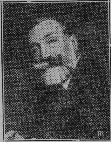
Madrid. — Don Manuel A. de Avila, Ministro Plenipotenciario de España en Viena.

En Lluch, a los pies de la devotísima imagen de Ntra. Señora, ofreceremos a la aceptación y a la bendición de Dios nuestro empeño de no cejar en la empresa de apostolado acometida, y allí mismo también aceptaremos de antemano y con