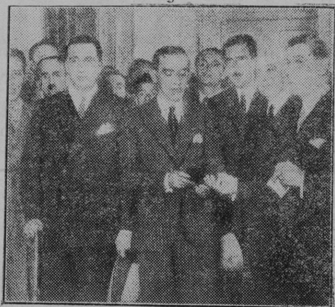
Oviedo. — Homenaje a don Ramón Pérez de Ayala. El vicepresidente de la Diputación entregando al embajador de España en Londres, el manifiesto de las autoridades y entidades de la ciudad con motivo de una lujosa cartera.

Es decir, señores, que para nosotros la propiedad no es un derecho absoluto; es un derecho limitado por todos aquellos fines y por todas aquellas consideraciones sociales que nacen de la igual-