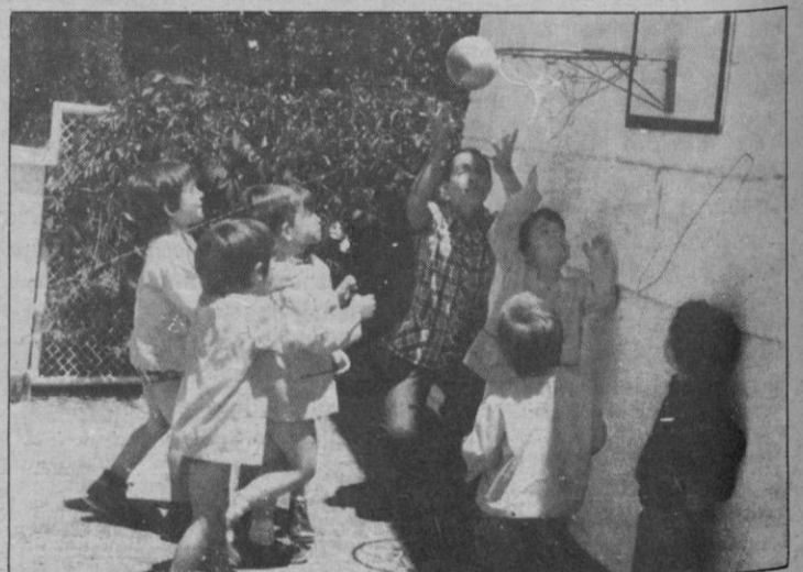
Escuelas: La de baloncesto tiene muchos «padrinos»