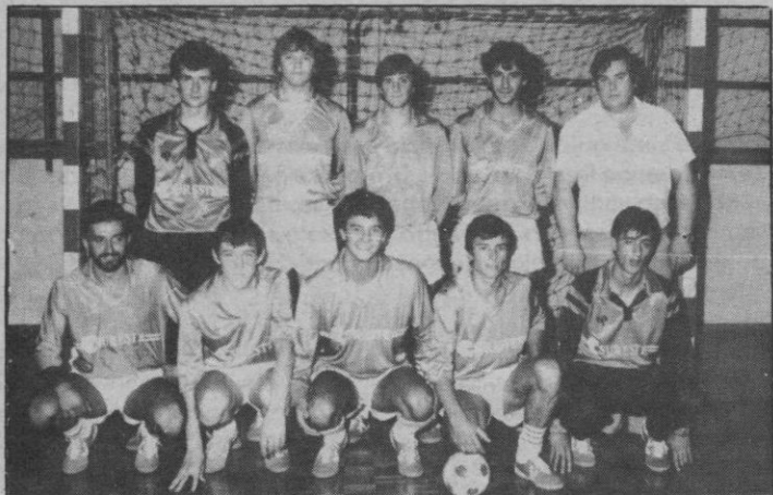
Seguros Sureste quiere un «grande»

S. Sureste quiere a Uruguay • Santiuste, pequeño premio • Nuevas competiciones • Sin sanciones