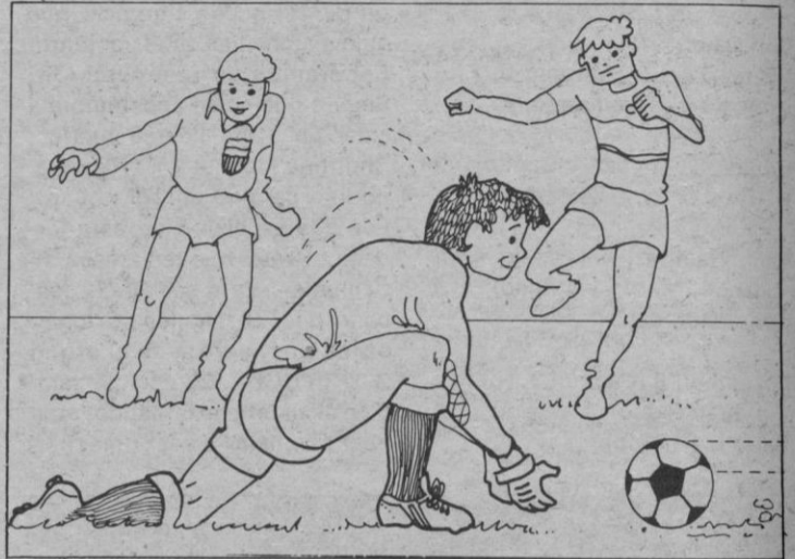
El fútbol, bien; «sólo» le faltan campos

tipo de arena sería la posible de extender. En quince días podrá estar concluido.