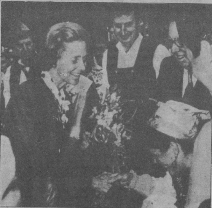
La Reina Fabiola de Bélgica felicita a una de las integrantes de los grupos folklóricos que intervinieron en Bruselas en el espectáculo «España baila», organizado con motivo del Festival Europalia 85. Los bailarines ofrecieron una muestra de las danzas de diversas regiones españolas.

Según la versión de Nery Jonás, que se confiesa «muy avergonzado», las dos mujeres —una morena y atractiva y otra negra y bellísima— se le beneficiaron a punta de revólver por espacio de una hora.—Efe