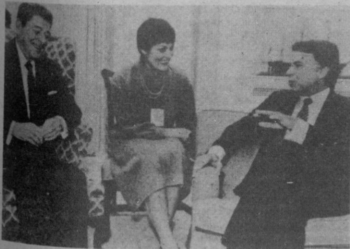
Ronald Reagan conversa con Felipe González durante la breve entrevista que mantuvieron ayer en la Casa Blanca.

Washington. — «Hasta que no haya una definición en el referéndum» sobre la permanencia en la OTAN «no habrá resultados concretos» sobre la reducción de efectivos militares norteamericanos en España, afirmó ayer el presidente del Gobierno español, Felipe González, en la conferencia de prensa que ofreció al final de su estancia privada en Estados Unidos. Fuentes gubernamentales españolas afirmaron ayer, por su parte, que Estados Unidos entiende ya las razones por las que España desea la reducción de las bases y de los efectivos norteamericanos en nuestro país, y está dispuesto realmente a negociar.