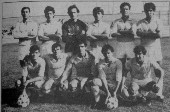
G. Segoviana: ¿Podrá salir este equipo?

Se llega ya, con la jornada que se disputa en este fin de semana, a la quinta del torneo de la Tercera División. Los encuentros que forman parte de la misma son éstos: