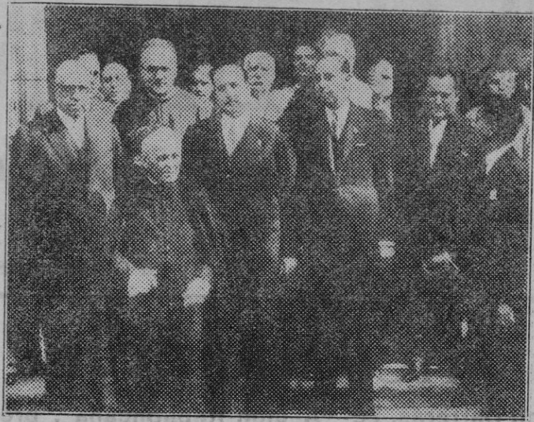
Barcelona. — Las autoridades saliendo del Oficio Divino celebrado en la parroquia de San Miguel con motivo de la Fiesta Mayor de la Barceloneta, la popular barriada de los pescadores.

Y hacemos punto. Son muy graves los intereses en juego y, por ello, como españoles y como católicos quisiéramos que éste que comentamos fuese el último incidente provado por una conducta del Gobierno español poco amistosa para la Iglesia. Palabras pronunciadas ayer por el presidente del Consejo y otras declaraciones oficiales u oficiosas no permiten esperar que en las esferas oficiales se hayan hecho cargo de la patriótica necesidad de que todos los españoles puedan convivir y convivan,