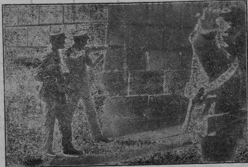
De la huelga general de Barcelona.—Momento en que la Policía hace fuego contra los que se resisten en el Sindicato de Construcción de la calle de Mercaders.