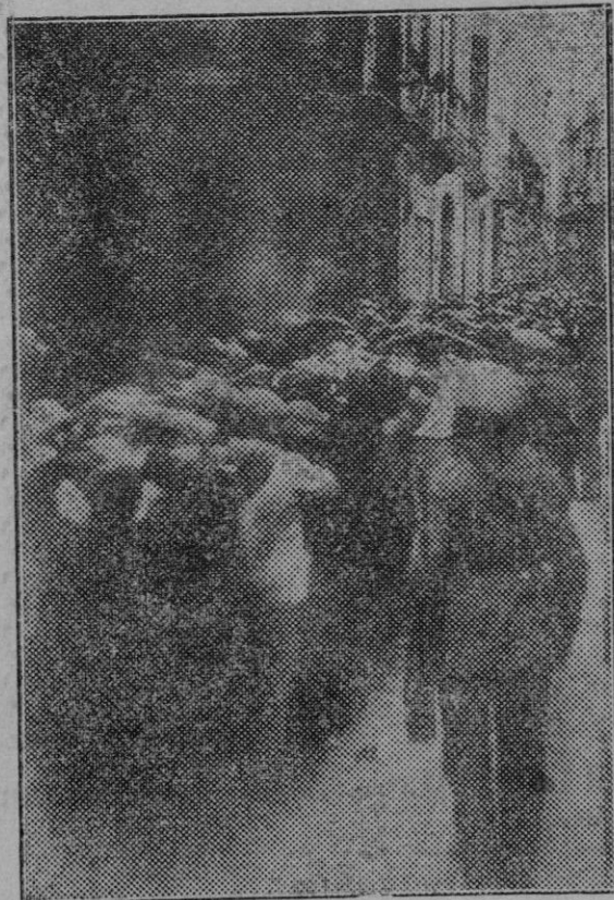
De la huelga general de Barcelona.—Detenidos pertenecientes al ramo de Alimentación en la calle de Codols, en número de cerca de 200.

Almacenes CASA ROCA Lonjeta, 53 ARTICULOS PARA VERBENAS