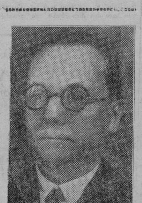
Madrid.— El catedrático don José Giral, que ha sido nombrado rector de la Universidad Central.

París.—"L'Echo de Paris" publica de su corresponsal en Londres el siguiente despacho que debe acogerse con reserva, y que transmitimos