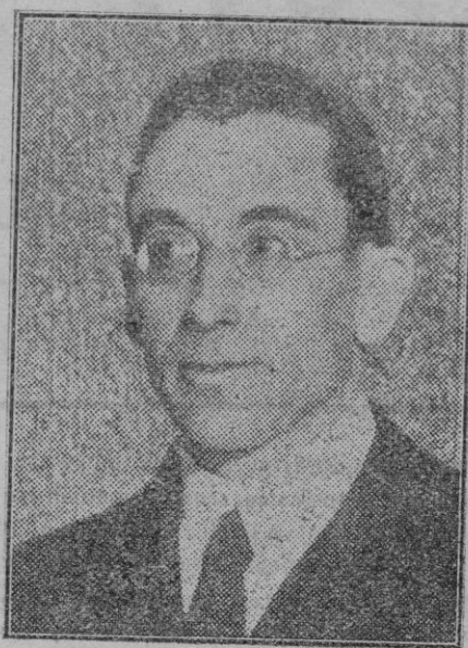
Don Luis de Zulueta, nombrado embajador de España en el Vaticano.

"Uno de los postulados de la República y, por consiguiente, de este Gobierno provisional, es la libertad religiosa. Con este derecho España se sitúa en el plano moral y civil de las democracias de Europa y de aquellas democracias de América que, desprendidas de España, se anticiparon en la conquista de las instituciones que aquí acaban de estatuirse. Libertad religiosa es, en la escuela, respeto a la conciencia del niño y del maestro. El Gobierno provisional de la República desertaría de sus compromisos si rápidamente no se inclinara ante este deber y lo cumpliera. Corresponderá a las Cortes Constituyentes resolver sobre la estructura del Estado, la delimitación de Poderes y las orientaciones de la enseñanza, pero no se invade la función que a las Cortes Constituyentes compete, disponiendo que España deje de ser una excepción y haciendo que en la escuela española haya una libertad