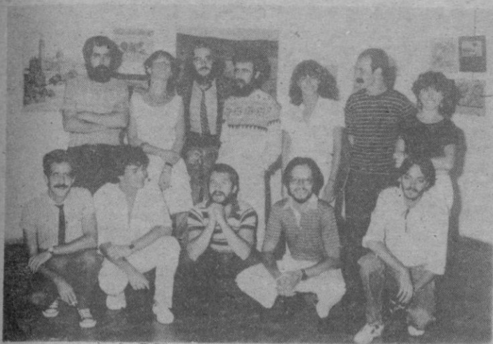
En la foto, los doce pintores que este año nos han visitado.

Cerca de trescientas obras componen la exposición que el sábado pasado fue inaugurada en el Torreón de Lozoya por los alumnos pensionados de las Facultades de Bellas Artes. El gran esfuerzo realizado para tener todos los cuadros enmarcados y la exposición lista para la fecha se está viendo recompensado por las opiniones muy favorables de los entendidos so-