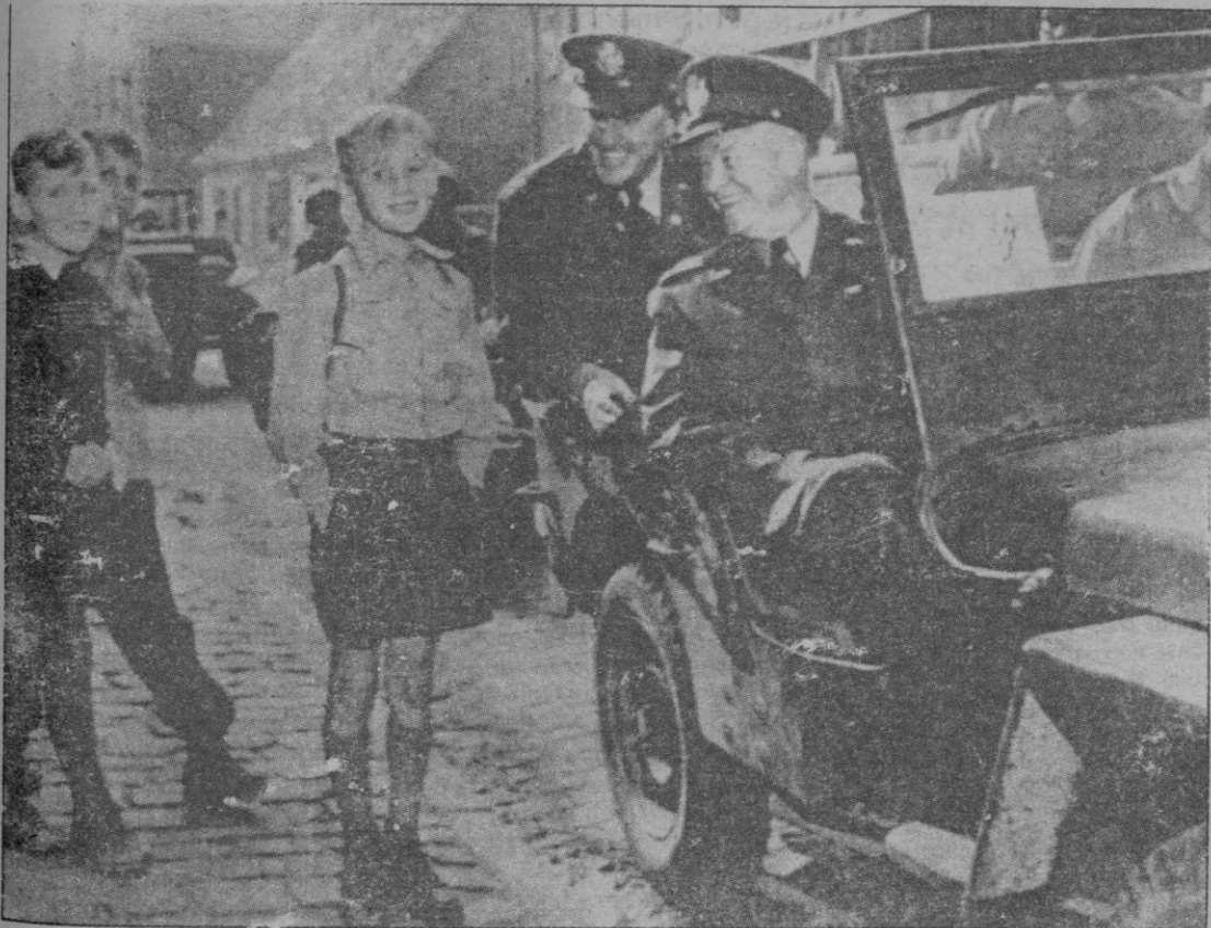
El general Dwight D. Eisenhower, jefe de las fuerzas aliadas en Europa, charla desde su jeep con unos niños alemanes a la entrada de Francfort, días antes de la capitulación del Tercer Reich.

todas las guerras en las que ha tomado parte, el Pentágono ha condenado a muerte al viejo y romántico «Jeep».