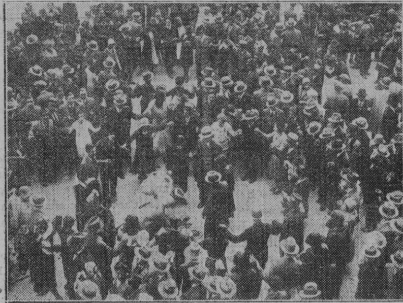
Barcelona. — La fiesta del estudiante. Audición de sardanas en la Plaza de la Universidad.

Ayer a las once y media visitó al señor Gobernador el Ayuntamiento en