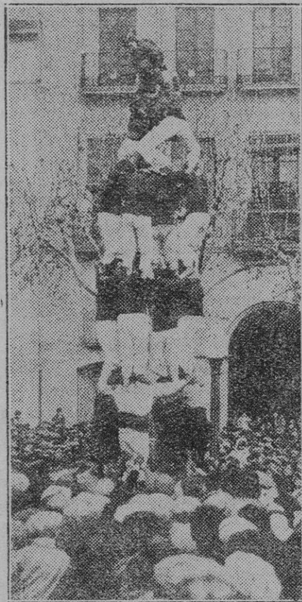
Valls (Tarragona). — Los "Xiquets de Valls" levantando frente al Ayuntamiento sus típicos "castillos".