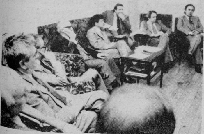
La reunión se siguió con interés por los presentes