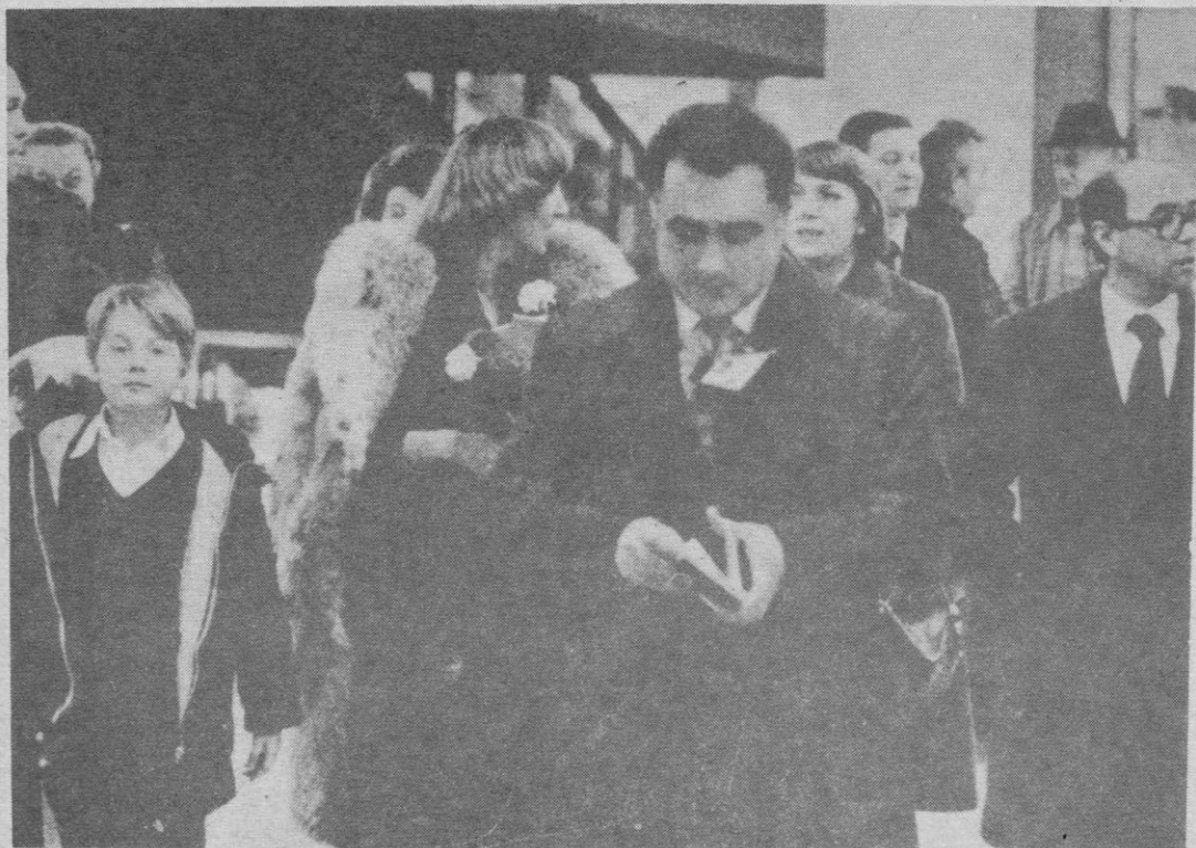
SALIO DE ESPAÑA EL SEGUNDO SECRETARIO DE LA EMBAJADA SOVIETICA

La multitud enfurecida prendió fuego a las instalaciones de la factoría.