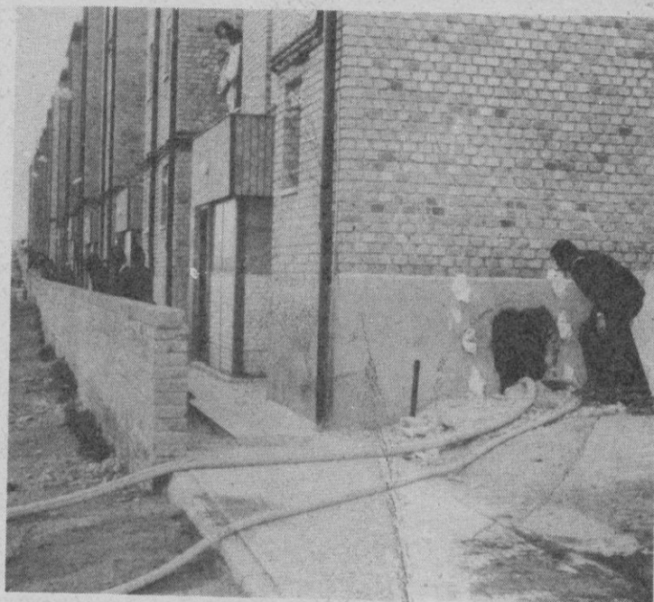
Un bombero aparece junto al boquete que ha sido necesario abrir para evacuar los residuales.

residuales haciendo un boquete en el cerramiento del sótano, ya que desde hacía días se venían notando humedades continuas que han llegado hasta el primer piso, han manifestado que se trata de un posible descuido al no haber dejado instalado el colector de residuales que recoge las bajadas de los servicios de las viviendas, por lo que éstas han estado vertiendo directamente al sótano. Ver-siones cercanas a la construc-