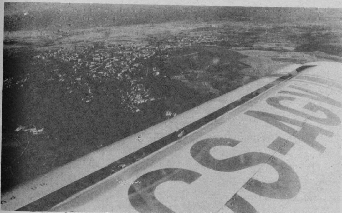
En breve se podrá aterrizar en Fuentemilanos. En la fotografía, se aprecia un ala del avión que sobrevuela Segovia.

Una escuela de vuelo sin motor alemana, muy interesada en utilizar las nuevas instalaciones