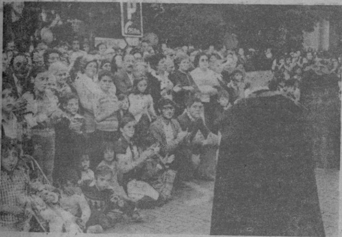
El público se agolpaba al paso de la imagen.

Fuerzas militares rindieron honores y las primeras autoridades la acompañaron hasta la catedral