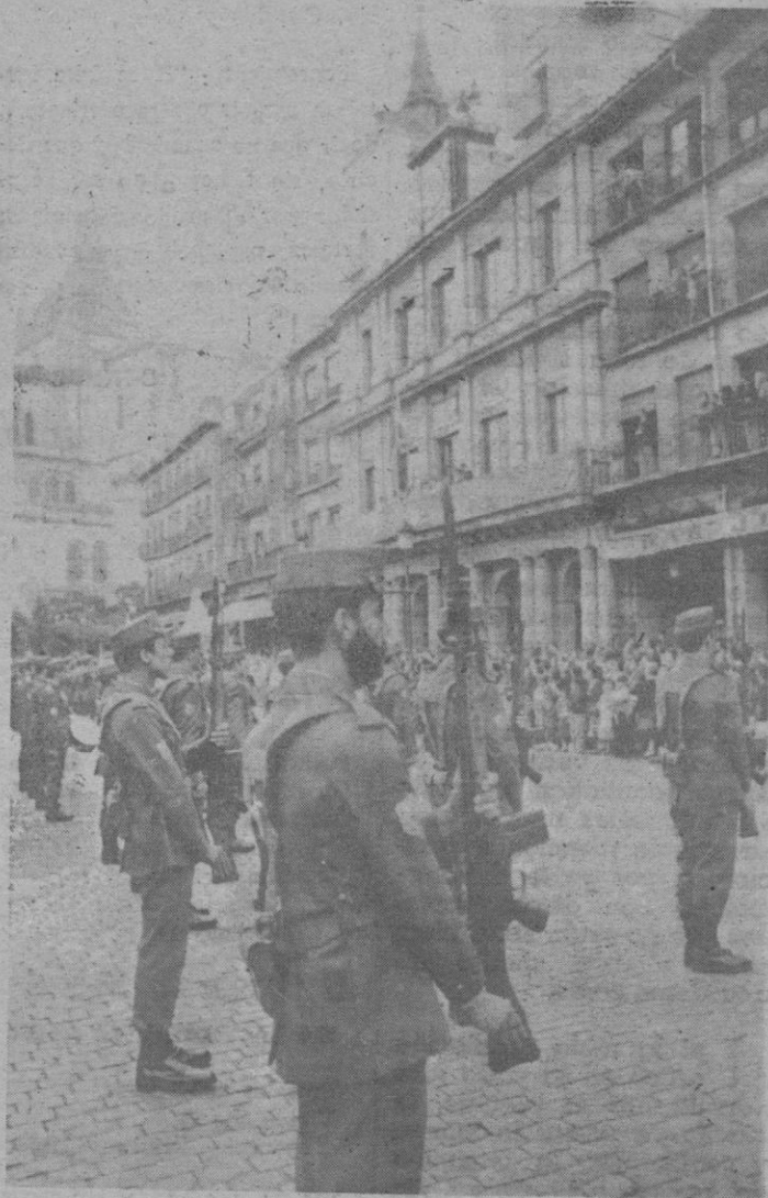
La batería de honor presenta armas al paso de la imagen, que se vislumbra al fondo de la fotografía.

Recordamos que las misas que diariamente se ofician ante el altar de la Virgen, aparte las anteriormente indicadas, son: Días laborables: 8, 8,30, 9, 9,45 y 11,30; días festivos: 8, 9, 9,45, 11, 12, 13, 14, 18 y 19.