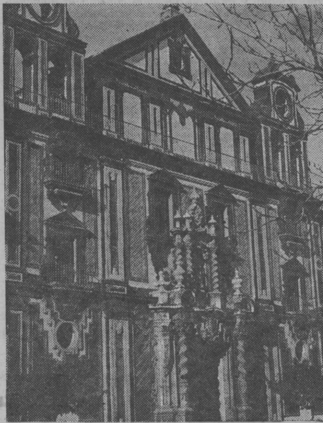
Fachada de la iglesia de la Merced