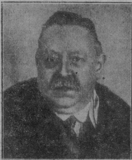
Buenos Aires. — El general Uriburu, alma de la revolución que obligó a presentar la dimisión al señor Irigoyen, y presidente del actual gobierno provisional.