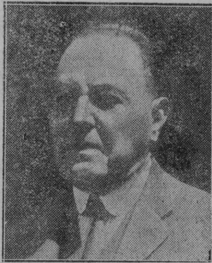
Buenos Aires. — El presidente de la epública Argentina señor Irigoyen, a quien la revolución triunfante dirigida por el general Uriburu obligó a dimitir.