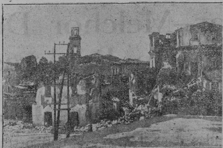
La catástrofe sísmica de Nápoles.—Estado que ofrecen las calles de una pequeña villa napolitana destruída por los terremotos que han asolado la región

Ayer llegó el yate norteamericano "Titania", procedente de la mar.