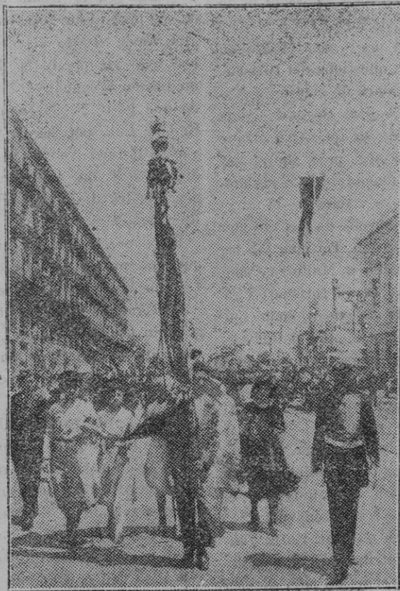
Barcelona.—Llegada de los socios de lo "Rat Penat" que, llevando al frente la bandera, se dirigieron al Ayuntamiento donde se celebró una recepción en su honor.