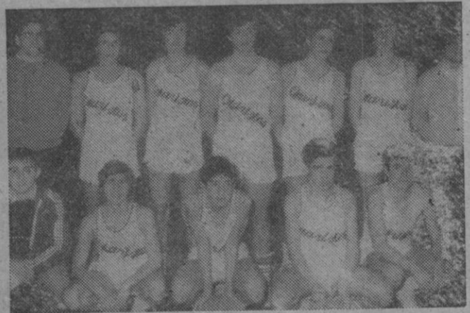
Baloncesto: Equipo cadete del colegio de HH. Maristas, que participó en el encuentro Segovia-Valladolid, el pasado día 28