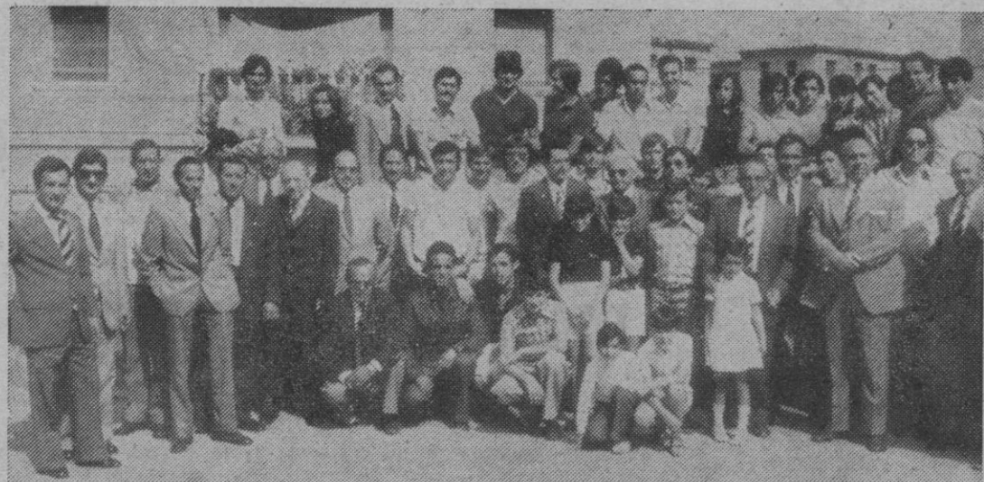
He aquí a los jugadores, entrenador y varios directivos de la G. Segoviana, rodeados de simpatizantes, después del acto religioso que ayer tuvo lugar en la iglesia de San José Obrero. Seguidamente se ofreció una copa de vino en el domicilio social.