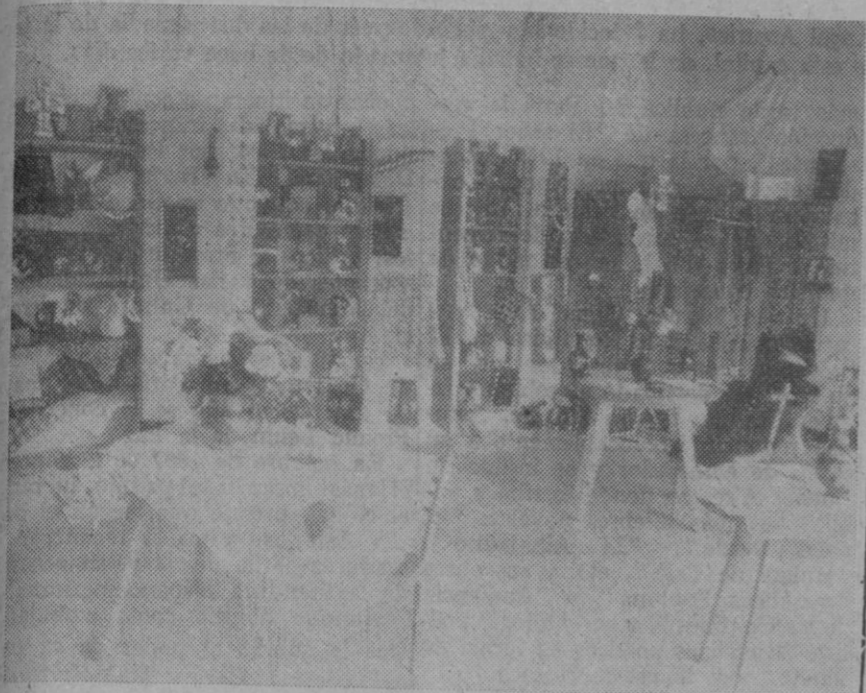
En la Granja-Escuela de la Caja de Ahorros ha quedado abierta al público una exposición de los trabajos realizados por las alumnas durante el presente curso. La muestra es muy interesante y refleja la amplia labor docente que se lleva a cabo en dicho centro.