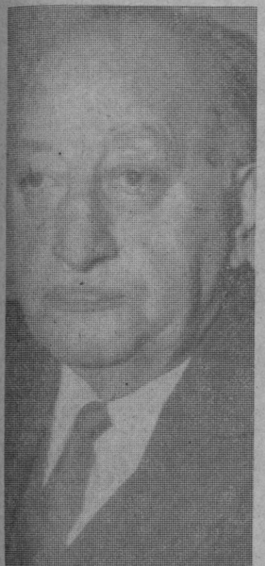
En Madrid ha fallecido Miguel Angel Asturias, premio Nobel de Literatura, noticia de la que informamos en página cuarta.