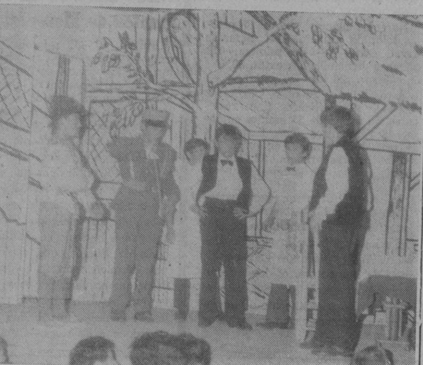
Se celebró ayer, como anunciamos, un festival artístico a cargo de los alumnos de la Agrupación Mixta Escolar de Abades, con representación de varias obras teatrales, exhibición de danzas e interpretación de obras del cancionero popular. En la fotografía, un momento de una de las representaciones escénicas.