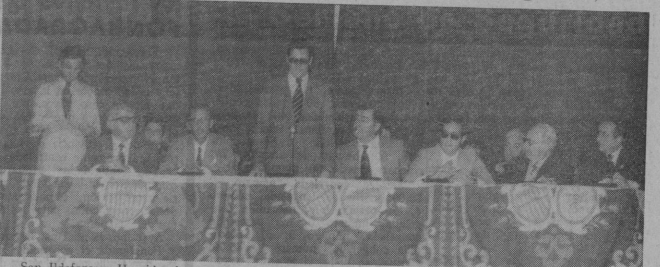
San Ildefonso.—Ha sido clausurada la Semana de Seguridad que se ha venido celebrando en este Real Sitio, organizada por la empresa Esperanza, S. A. El desarrollo de las jornadas y el interés puesto en las mismas por los asistentes, hacen confiar en que los resultados que se deriven de ella sean notoriamente positivos.

El acto de clausura fue presidido por el delegado provincial de Trabajo, al que acompañaban otras personalidades segovianas, así como el director de la empresa y alto personal de la misma. En el acto de clausura hicieron uso de la palabra el director de la empresa y el delegado provincial de Trabajo, cerrando el acto y entregando los premios en metálico concedidos por la empresa.