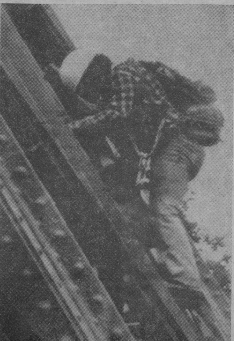
Un grupo de seis muchachos intentó la escalada de la torre Eiffel, en París, pero no pudieron concluir la ascensión. Fueron detenidos por la policía