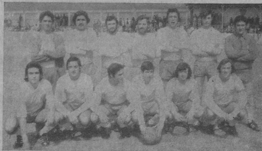
Equipo del Sporting Riazano.