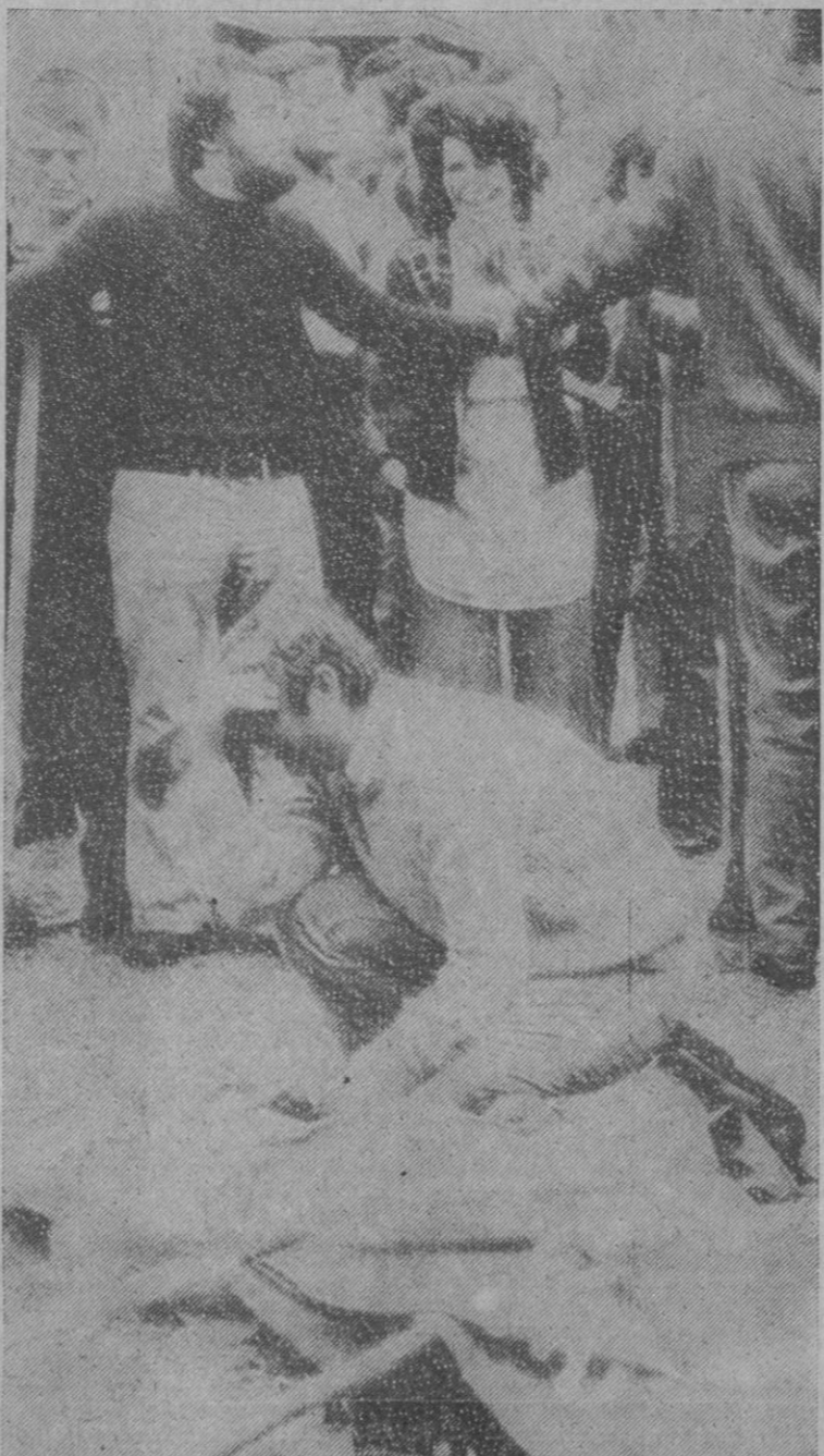
Este hombre llora sobre el cadáver de algún familiar o amigo, en el suelo de la Loggia en Brescia, después de la explosión de una bomba durante una manifestación antifascista. Murieron varias personas.