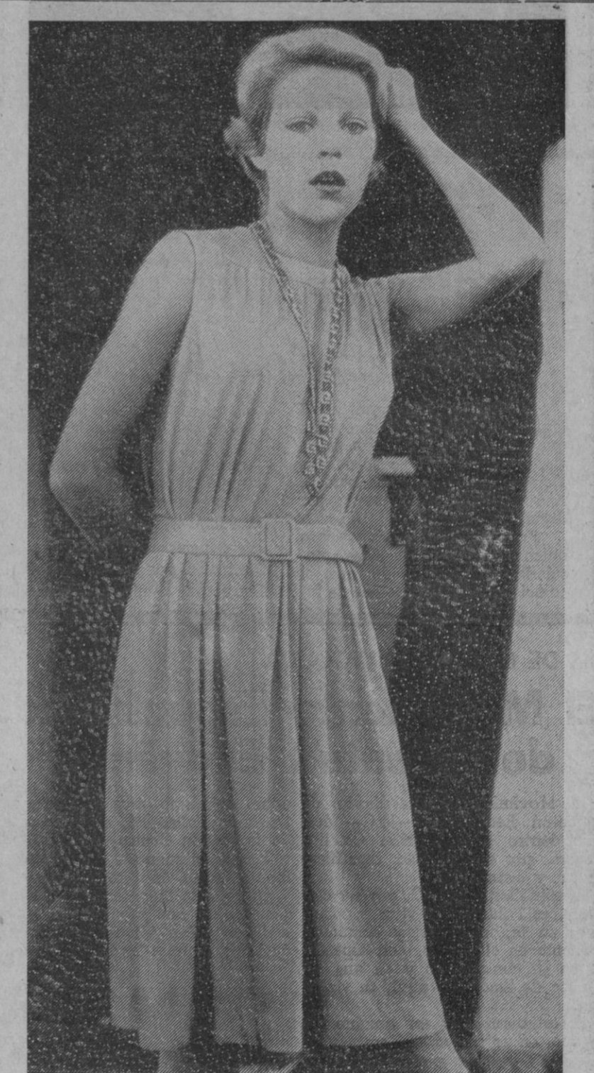
Ahora que el verano tendrá que llegar de una vez, a pesar de las alternativas de estos días, ahí tienen nuestras lectoras este modelo, creación de Rodier, de París.