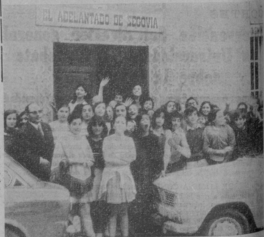
Un numeroso grupo de alumnos de uno y otro sexo del colegio nacional «Calvo Sotelo», de nuestra ciudad, acompañados de varios de sus profesores, han visitado esta mañana «El Adelantado de Segovia». Fueron recibidos en la redacción y posteriormente recorrieron detenidamente todas las instalaciones del periódico, sobre las que fueron informados ampliamente. La visita correspondía al plan de actividades extraescolares del centro donde cursan estudios.