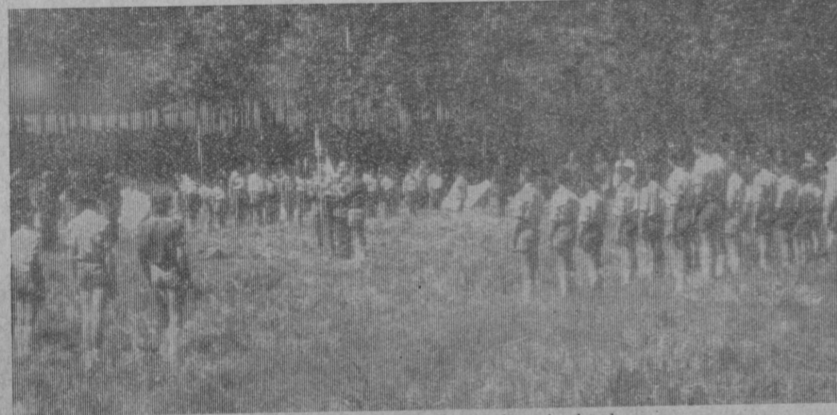
Los acampados presencian el acto de arriar banderas