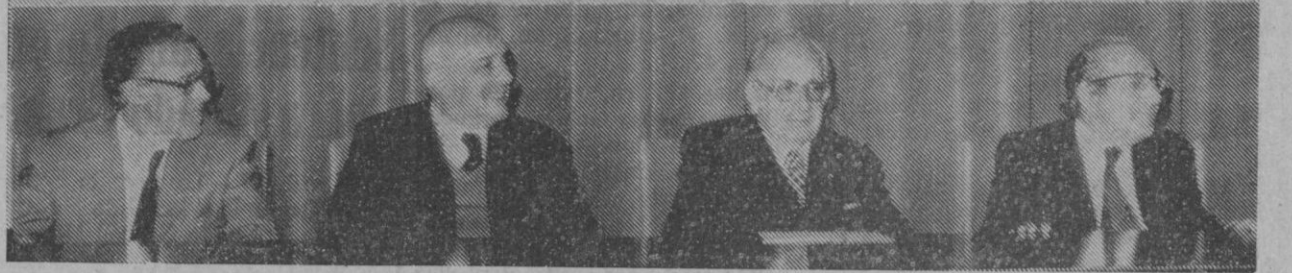
Ayer tarde, en la sala de la Obra Cultural de la Caja de Ahorros, tuvo lugar el acto de clausura de un curso de puericultura que, patrocinado por dicha entidad, se ha venido desarrollando a lo largo de cuatro meses, al que ha asistido un grupo de casi sesenta señoras y señoritas, todas ellas en posesión de diversos títulos.