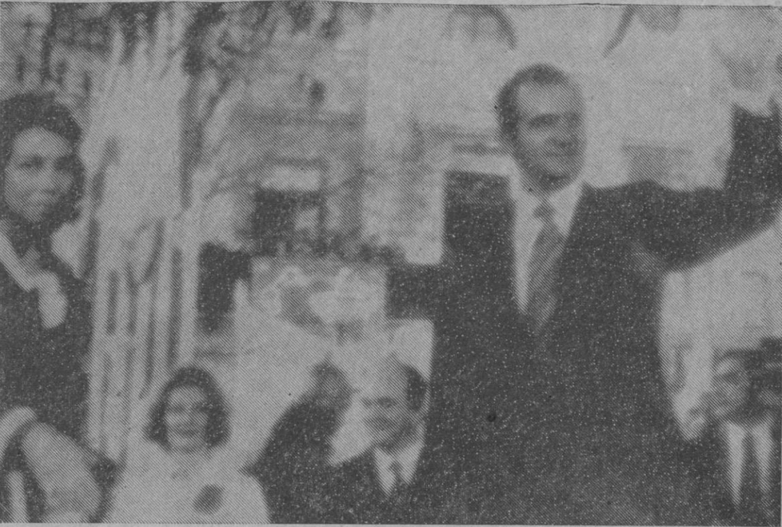
Murcia, 27.—La ciudad y la huerta de Murcia se congregaron esta tarde para recibir a los Príncipes de España, que realizan una visita de tres días de duración a esta provincia, para continuar luego hacia Albacete.

Sus Altezas Reales los Príncipes de España, don Juan Carlos y doña Sofía, hicieron ayer tarde, con su llegada a Murcia, una visita oficial por varias provincias del sureste español.