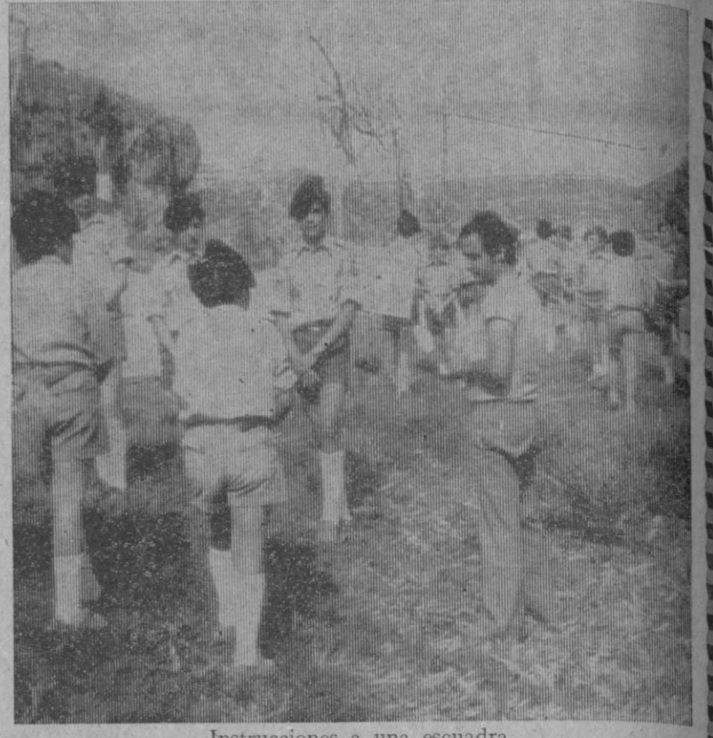
Instrucciones a una escuadra