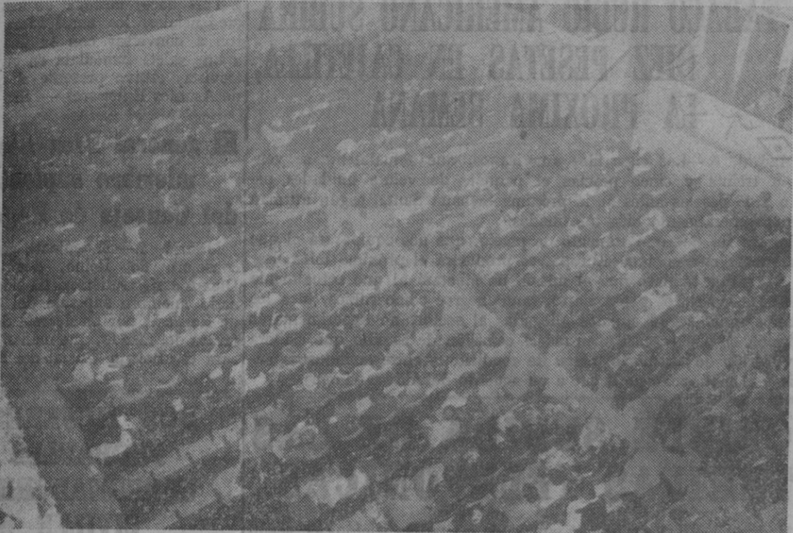
Fue numeroso el público que presenció desde el cine Cervantes, la retransmisión en directo y por circuito cerrado de TVE del acto de proclamación del Bimilenario