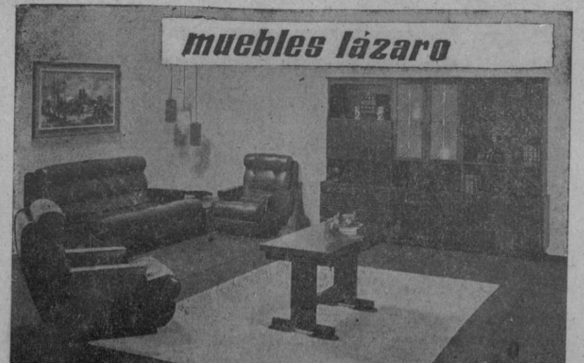
Salones desde 780 pesetas mensuales