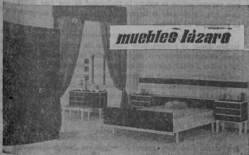
Dormitorios desde 990 pesetas mensuales