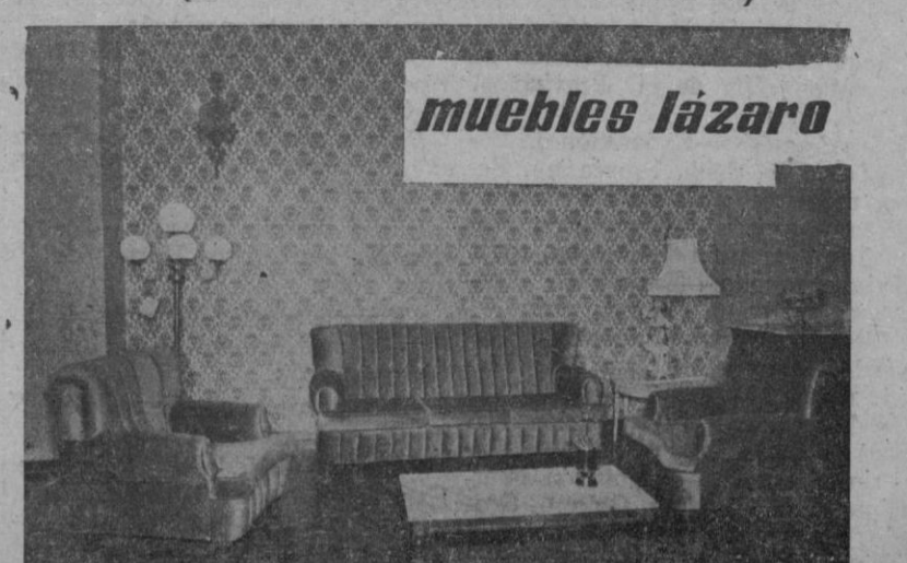
Tresillos desde 400 pesetas mensuales