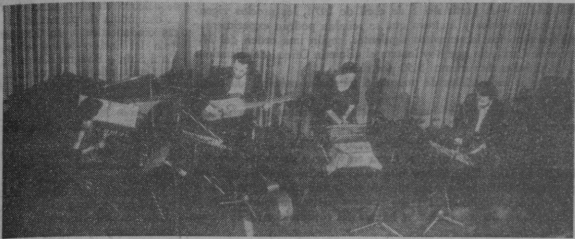
Una vista de «Atrium Musicae, que dió un breve concierto de música antigua