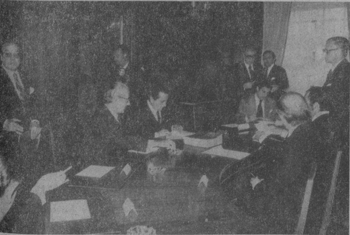
Un momento del acto de constitución oficial del Patronato Nacional del Bimilenario

En el salón principal del Gobierno Civil saludó a los altos cargos de su departamento que se encontraban presentes, miembros del Patronato Nacional del Bimilenario, autoridades provinciales y diversas representaciones. Asimismo el señor Cabanillas Gallas departió unos momentos con los informadores locales, a los que trató cariñosamente.