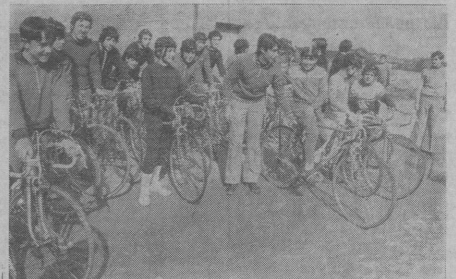
Un grupo de futuros ases momentos antes de tomar la salida

Se han celebrado ya las primeras pruebas prácticas de las enseñanzas que viene impartiendo la Escuela de Ciclismo de Segovia, sobre la que recientemente ofrecimos una amplia información.