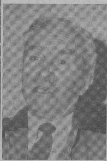
«El deporte que más conviene a todos, en principio, es la educación física de base»

—Toda actividad deportiva debe ir precedida de un reconocimiento médico. Cuando se presupone la existencia de algún síntoma de enfermedad esto es absolutamente necesario y en este caso será el médico el que aconseje las prácticas deportivas que más pueden convenir.