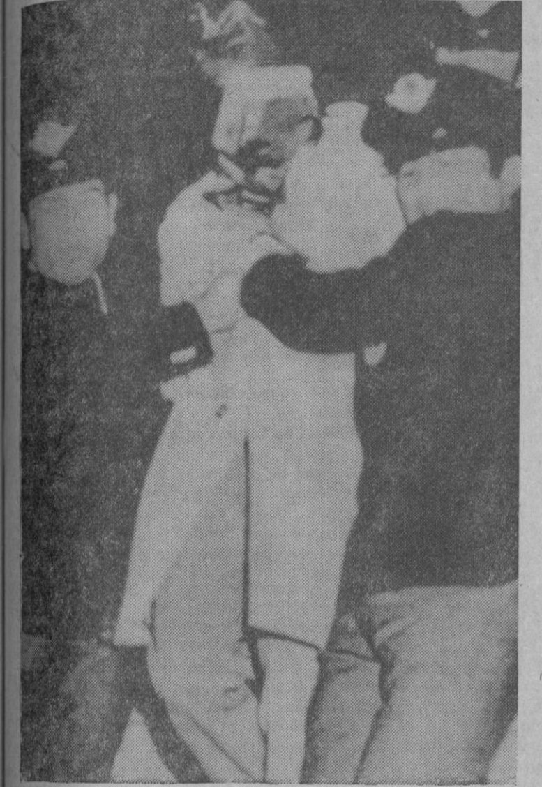
En la fotografía el secuestrador es bajado del avión por dos policías

Naha (Okinawa, Japón), 12.—Ha sido detenido el estudiante, que resultó ser un menor de edad, que secuestró un reactor Jumbo de las líneas aéreas japonesas, que volaba de Tokio a Naha. Agentes de seguridad, disfrazados de obreros del aeropuerto, penetraron en el avión y se apoderaron del secuestrador mientras se procedía a depositar en el aparato alimentos y bebidas.—Efe-Reuter.