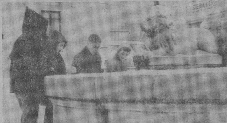
Ante el león de la fuente, los chavales hacen su tertulia, nieve, lluvia o haga sol