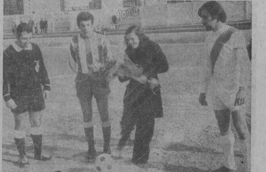
Preliminares del encuentro Acueducto-Colmenar.—(Foto Antonio.)

Anoche habían aparecido 970 boletines con 14 aciertos, 22.702 con 13 y 193.615 de 12.