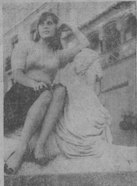
Las sirenas son buen motivo para que las jóvenes se fotografien.