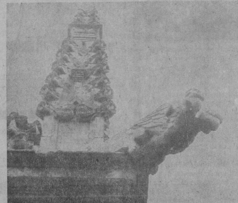
Gárgolas de la catedral, águila bicéfala