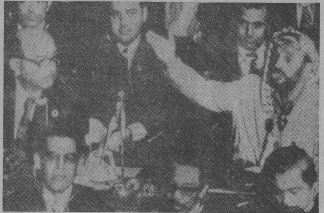
Un momento de la intervención del líder palestino Yasser Arafat en la Conferencia de Lahore

Se podrán hacer concesiones a los países industrializados que ayuden al mundo islámico, se dice en el indicado proyecto, cuya extensión es de cuatro páginas.—Efe-Reuters.