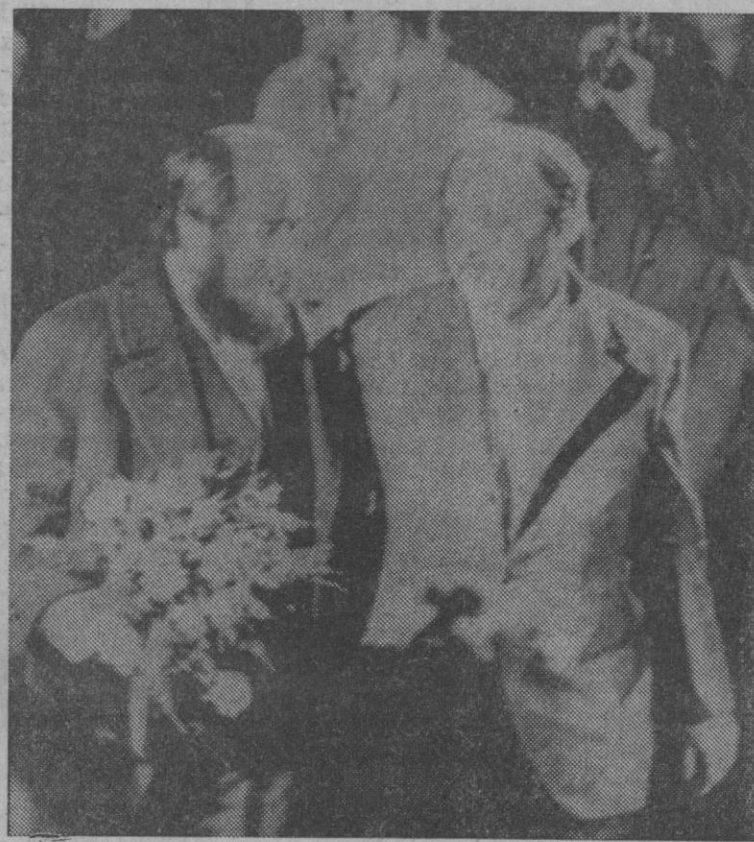
Solyenitsin aparece en esta fotografía acompañado de Boell, a la llegada de aquél a la residencia de campo de este último en la localidad de Langenbroich (Alemania Occidental)

Moscú, 13.—Las autoridades soviéticas han facilitado hoy un visado de salida al novelista disidente ruso Vladimir Maximov, para que por espacio de un año pueda visitar Francia, después que hace dos semanas se le comunicó que no le volvería a ser permitido salir del país.