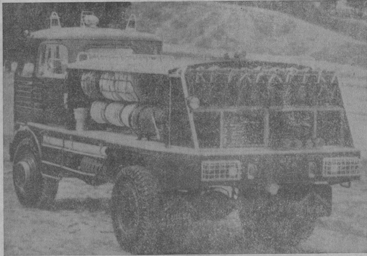
Motobomba todo terreno especialmente equipada para incendios forestales

Cinco son las bases aéreas de extinción de incendios forestales, situadas en Santiago de Compostela, con dos anfíbios CL-215 y tres Dornier; Sabadell, un avión tanque y dos avionetas; Ampurias Brava, con parecida dotación, así como en las bases de Requena, San Pedro, Alcántara y Villalba. Como se sabe, en nuestra provincia,