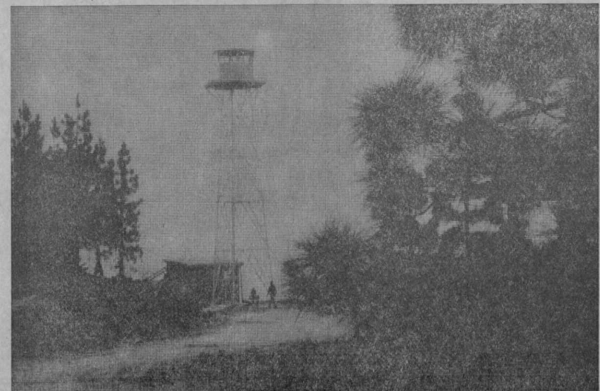
Torre para la vigilancia de incendios en San Juan de la Rambla (Tenerife)