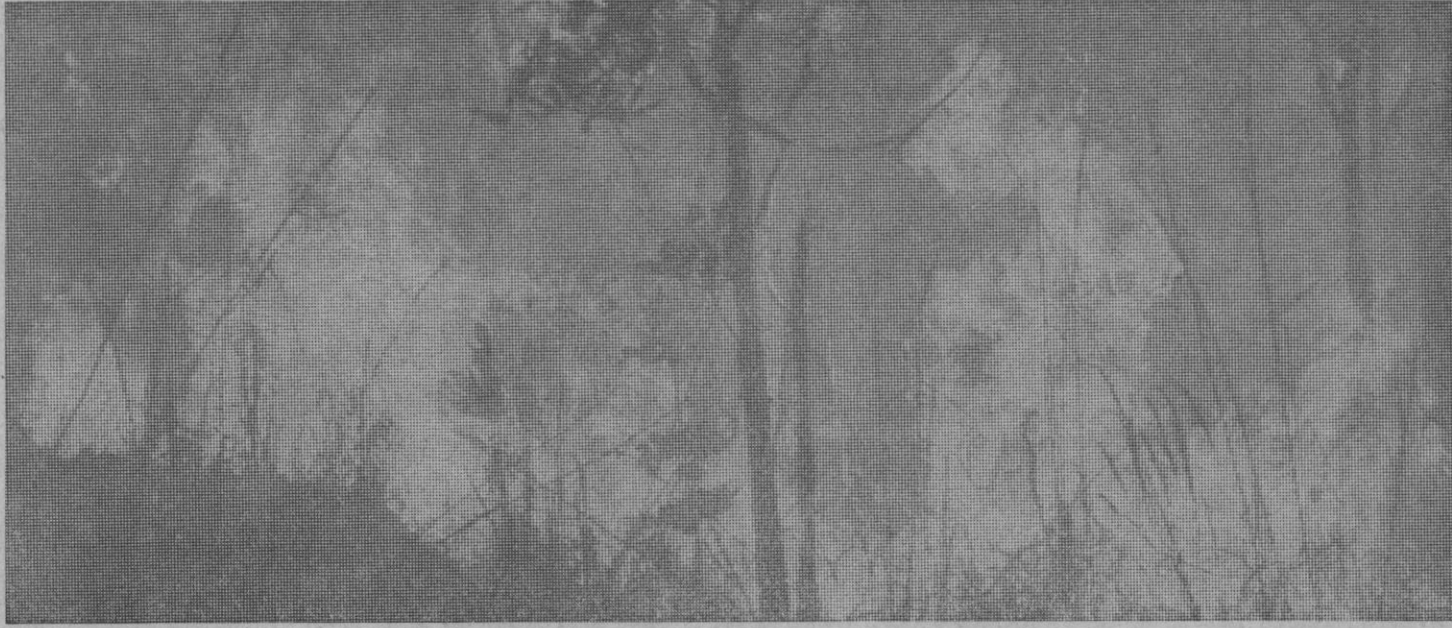
El bosque convertido en un infierno. "¿Quién quema el monte?"

En la sierra de Guadarrama se registraron 150 fuegos, afectando a 250 Has. arboladas. El 50 por ciento de los casos se debieron a negligencias y de ellos, el 34 por ciento a descuidos de fumadores