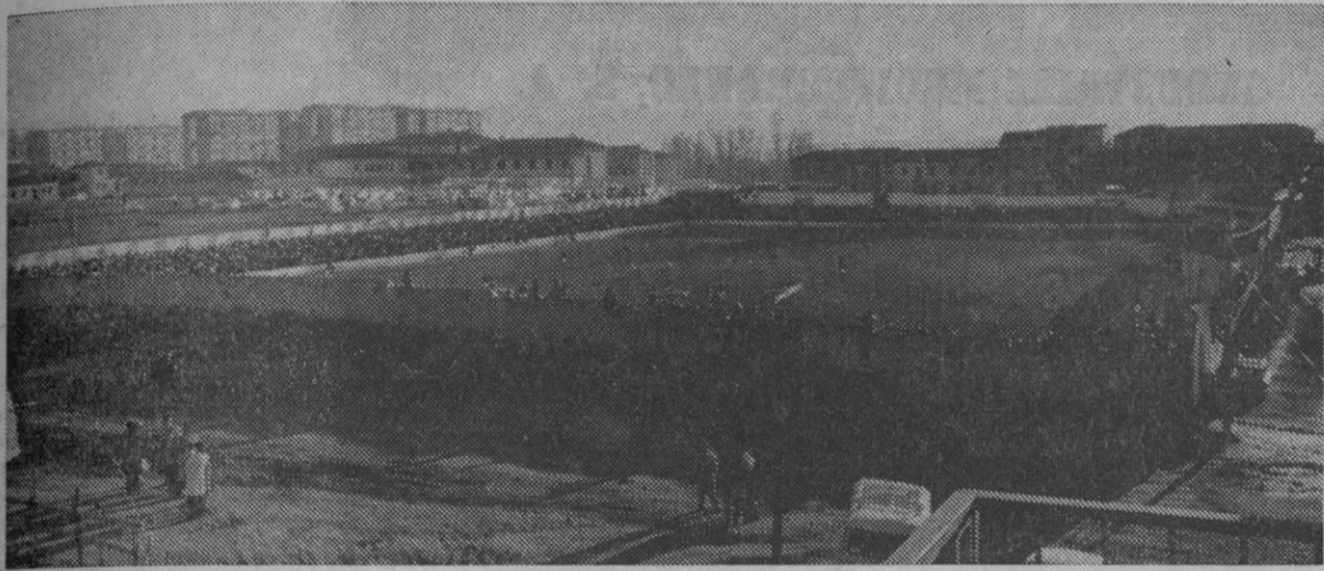
Panorámica de El Peñascal —con su rebosante lleno de ayer— tomada desde uno de los edificios contiguos.

Gran ambiente en el campo con cientos de seguidores toledanos y un tiempo para cada equipo