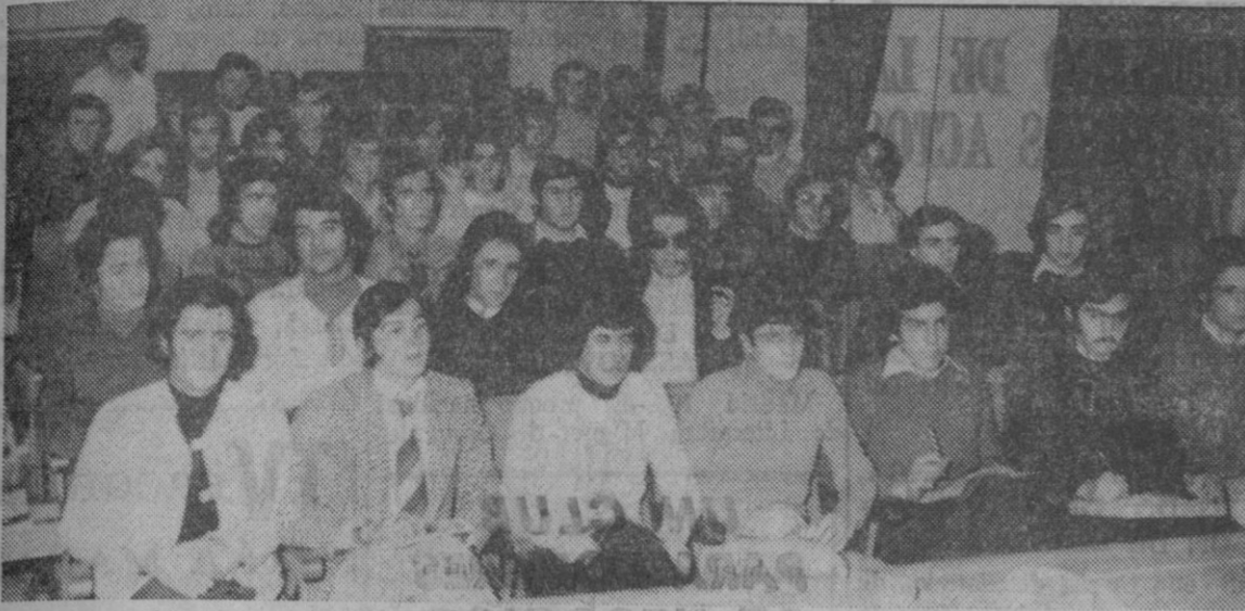
El grupo de jóvenes trabajadores que han asistido al curso.

Recibieron visitas de autoridades, jerarquías y mandos y asistieron a varias conferencias seguidas de coloquios