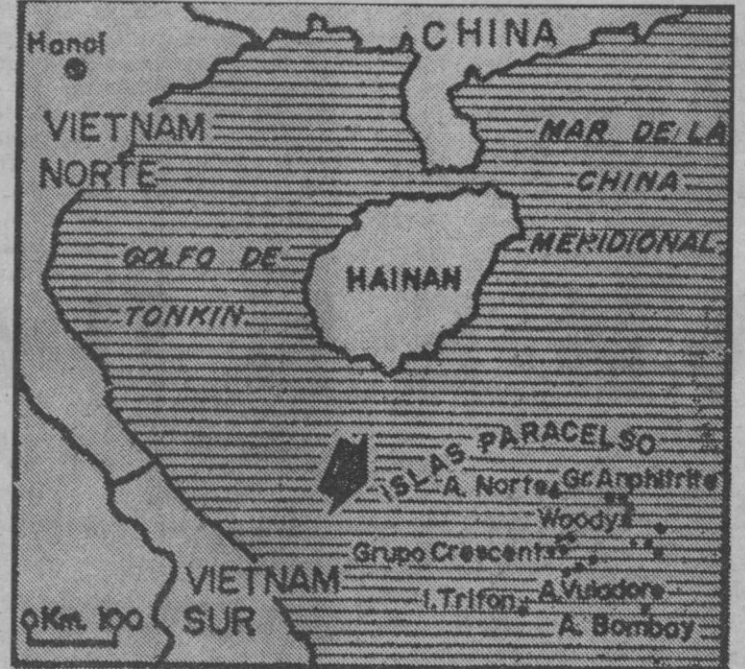
Situación de las Paracelso en el mapa

Pekin dice haber actuado en defensa propia y que las islas han sido siempre chinas