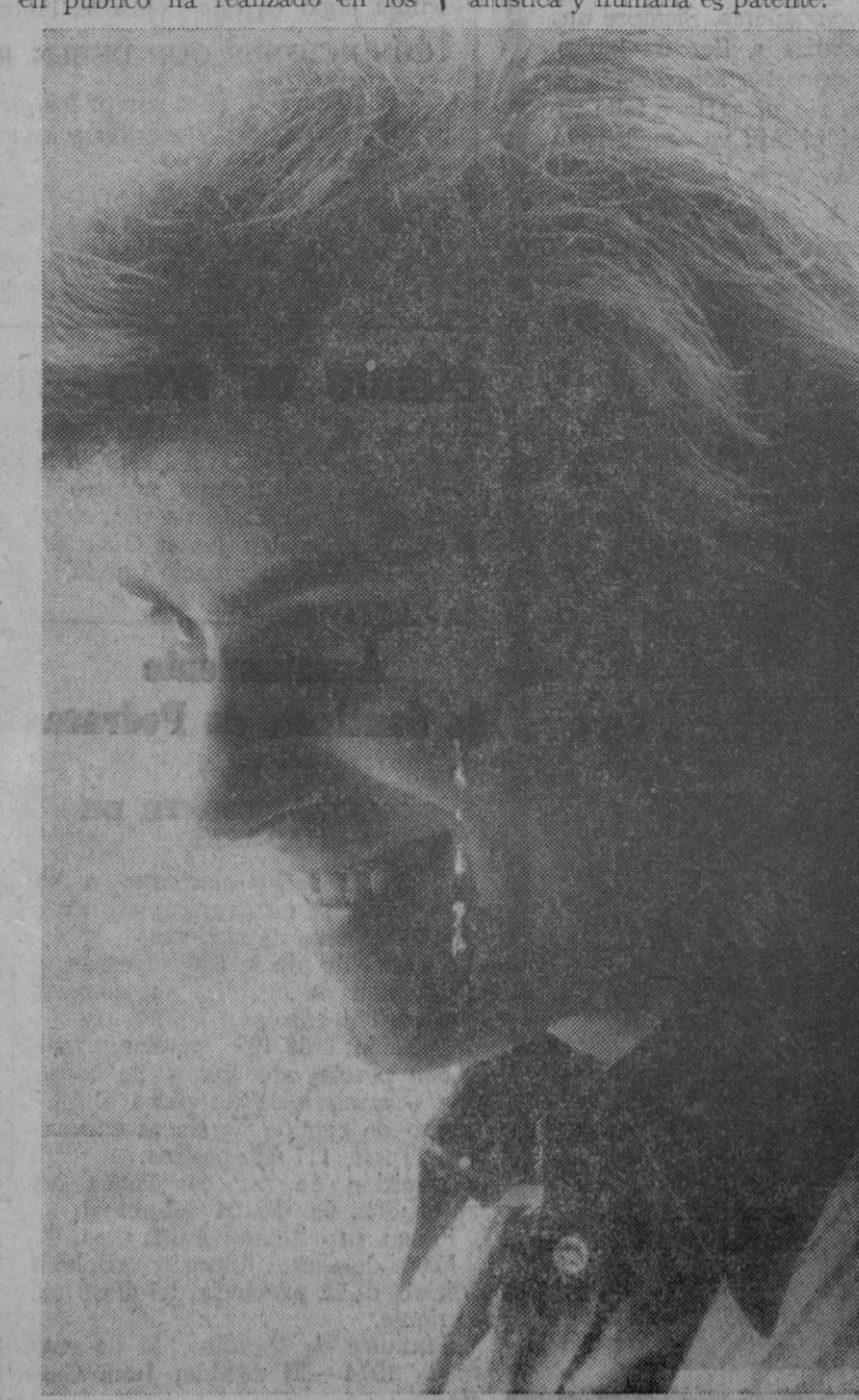
Se decide del todo y fija su residencia definitivamente en Madrid, desde donde recorre toda España cantando. Una nueva grabación con "Un adiós" y el éxito es doble, como intérprete y como compositor.