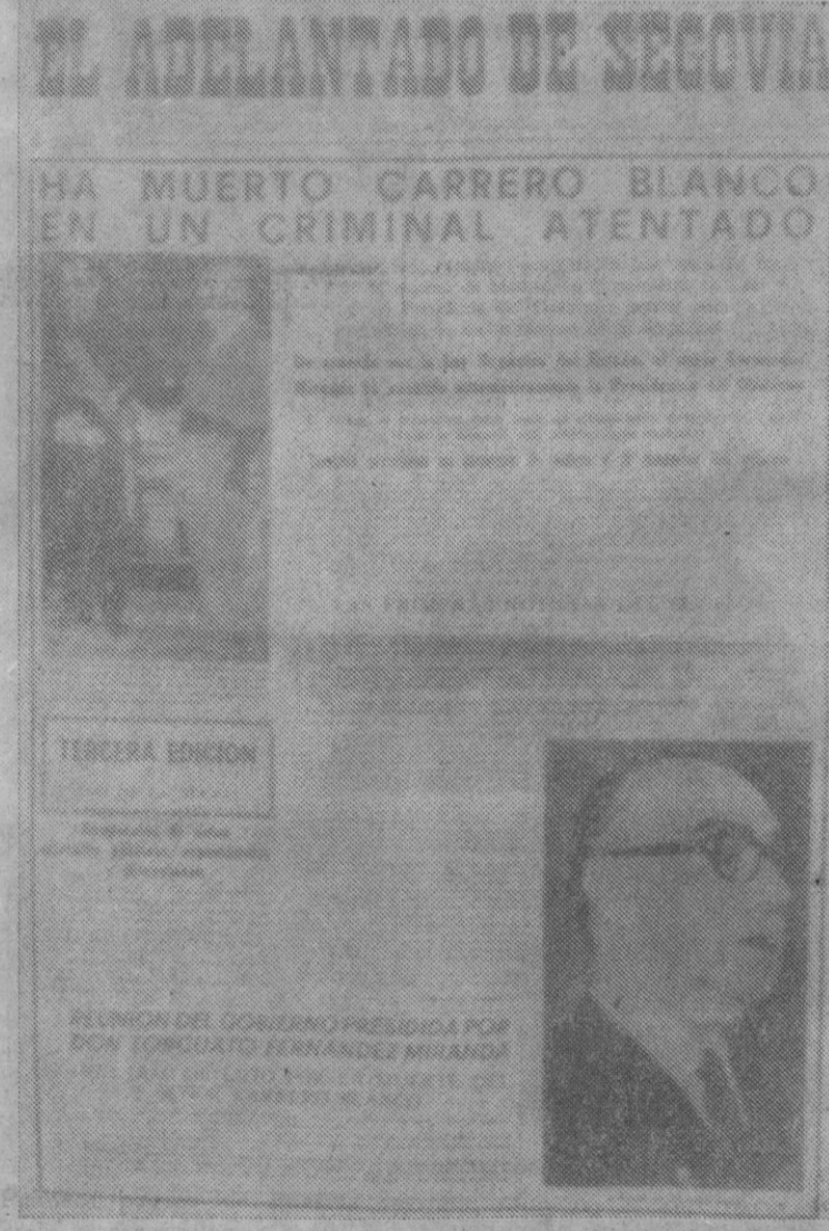
Primera página de nuestra segunda edición extraordinaria de ayer —tercera lanzada por el periódico en la tarde—, con las últimas noticias sobre el atentado.

LADREDA 25 NOS COMUNICA QUE EL DESFILE DE MODAS QUE DEBIA PRESENTAR HOY EN SU SALA EL MODISTO CAPELL SE HA APLAZADO HASTA NUEVO AVISO.