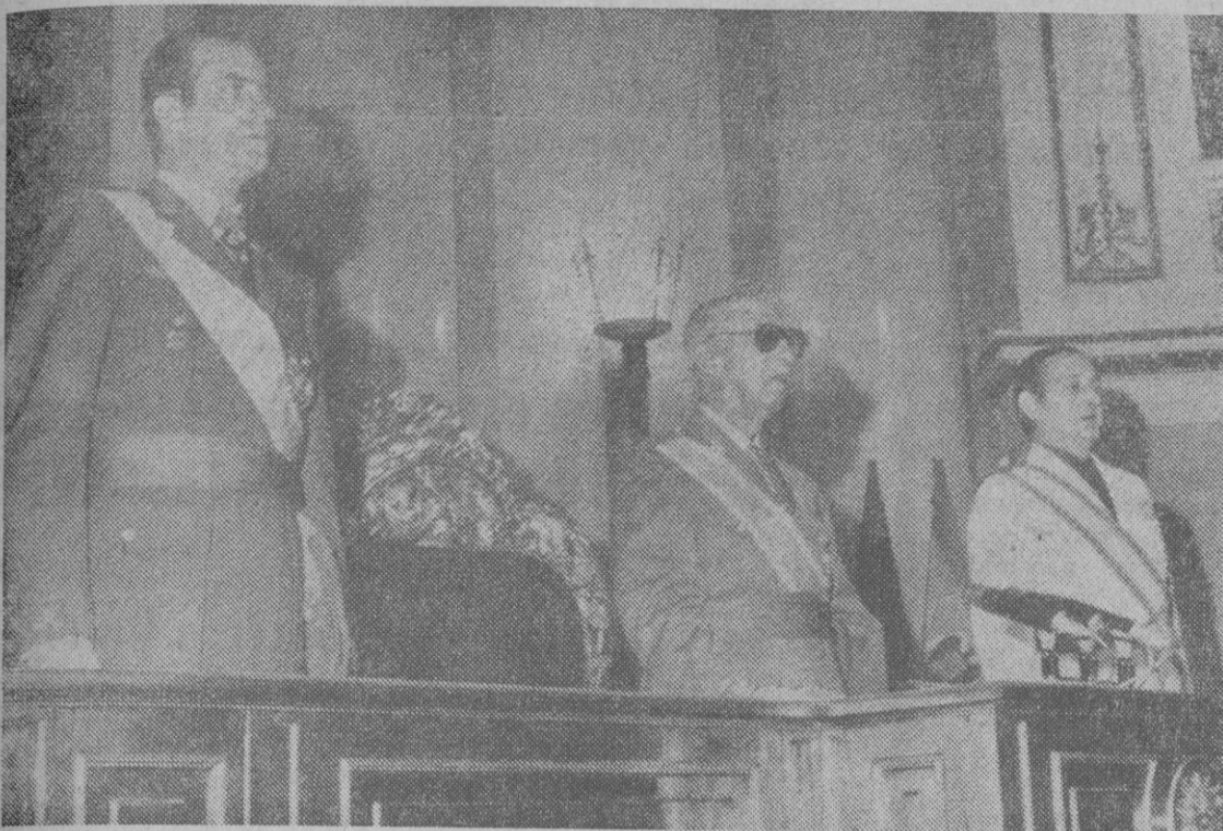
Su Excelencia el Jefe del Estado, el Príncipe de España y el ministro secretario general del Movimiento, en la presidencia del acto conmemorativo de la fundación de Falange Española, celebrado ayer en Madrid en la sede del Consejo Nacional del Movimiento.