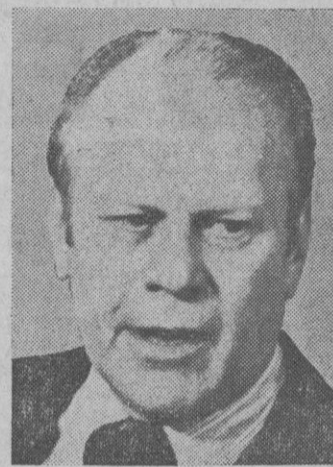
Gerald Ford, vicepresidente de USA

Tomando en cuenta y repitiendo el tema sostenido por el presidente en su conferencia de prensa del pasado viernes, la Casa Blanca dice que esta última información ha venido asimismo a poner en duda la integridad del presidente, "lo cual es una manifestación de la existencia de una atmósfera engañosa en la que se forjan falsas informaciones hirientes sobre el presidente, que luego son difundidas a los cuatro vientos dirigiéndolas al pueblo americano a través de los principales medios de comunicación de masas". —Efe-reuter.