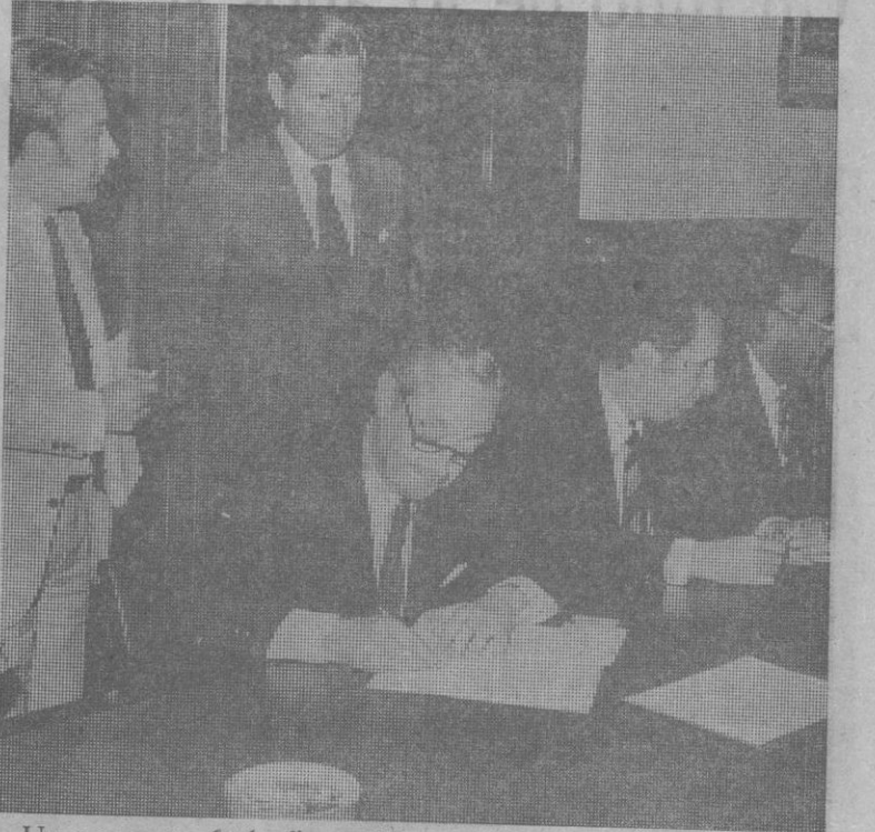
Un momento de la firma del contrato para la construcción de la nueva central nuclear Ascó II

La central entrará en funcionamiento hacia finales de 1978. Con ésta, son seis las centrales nucleares de 930 MWe que Westinghouse construye actualmente en España.