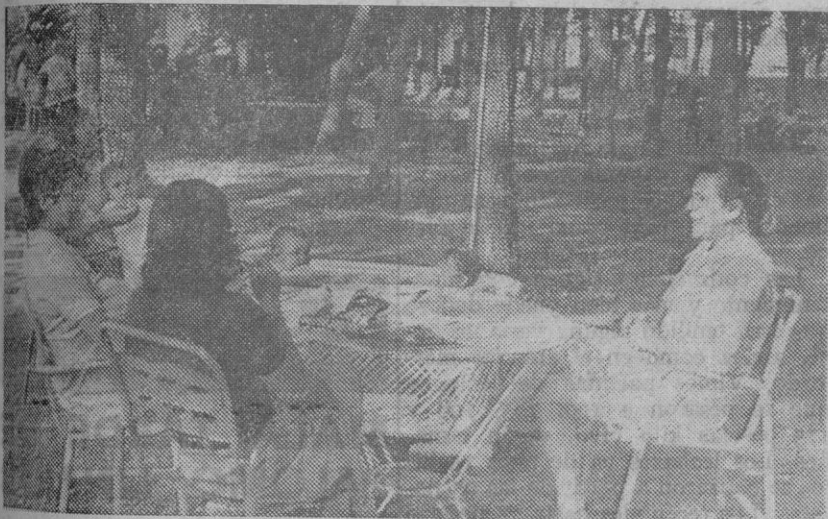
Arriba, una vista de las obras del nuevo pabellón que se construye; abajo, un grupo de señoras residentes charla amistosamente.