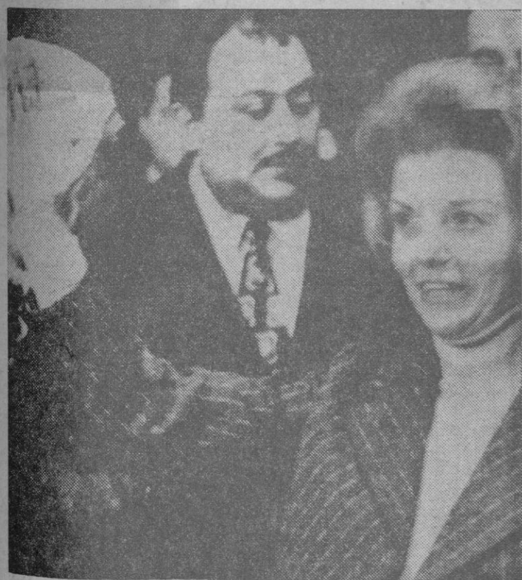
Isabel Martínez de Perón, esposa del expresidente argentino Perón, saluda a cuantos la aclaman en Buenos Aires, después de haber sido propuesta como candidata a la vicepresidencia de la nación por el partido justicialista