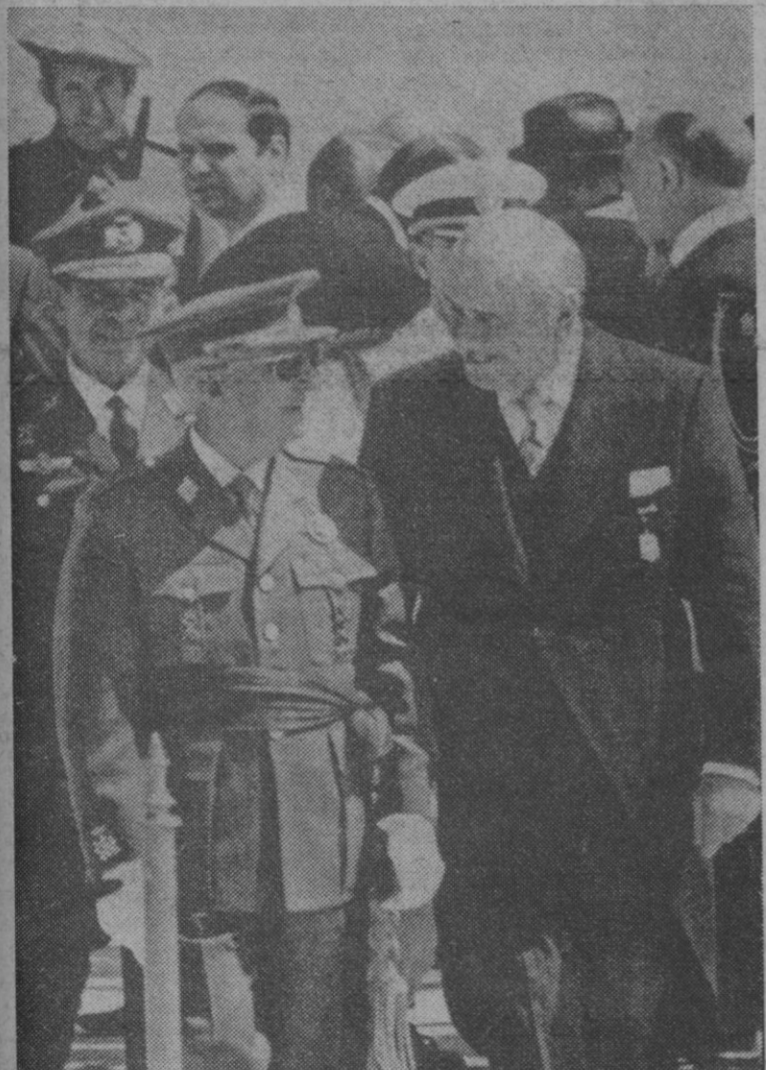
Los Jefes de Estado conversan minutos después de la llegada de Cárpora a Madrid