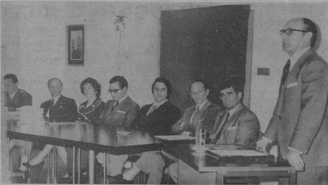
La presidencia del acto, durante la intervención del conferenciante