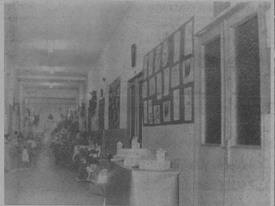
Un detalle de la exposición de trabajos manuales