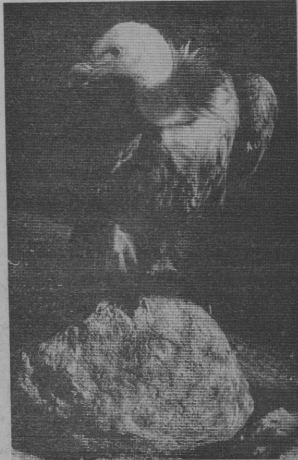
BUITRE LEONADO. EN OTRO TIEMPO ERAN NUMEROSAS