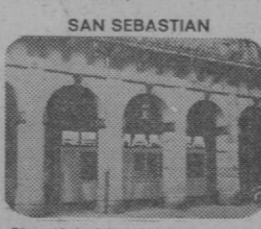
Plaza 18 de Julio, 15, bajos. Telefono 41-70-01

RESMAN, S.A. RENTAS ESPAÑOLAS MANCOMUNADAS (Grupo PROINMSA) VIA LAYETANA, 185 (EDIFICIO RESMAN, S.A.) telef. 221 0999 - 232 6958 - 232 4001 BARCELONA - 9