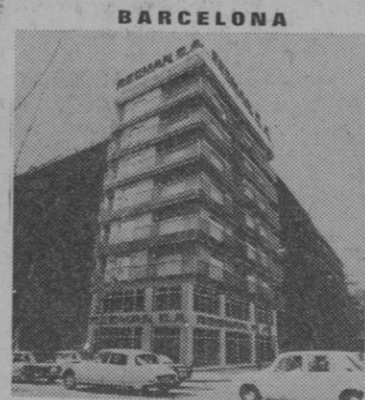
EDIFICIO RESMAN (VIA LAYETANA, 185) (ESQUINA A DIAGONAL)

AL REEMBOLSO DE SU INVERSION según valor adquirido por cotización del FONDO MANCOMUNADO