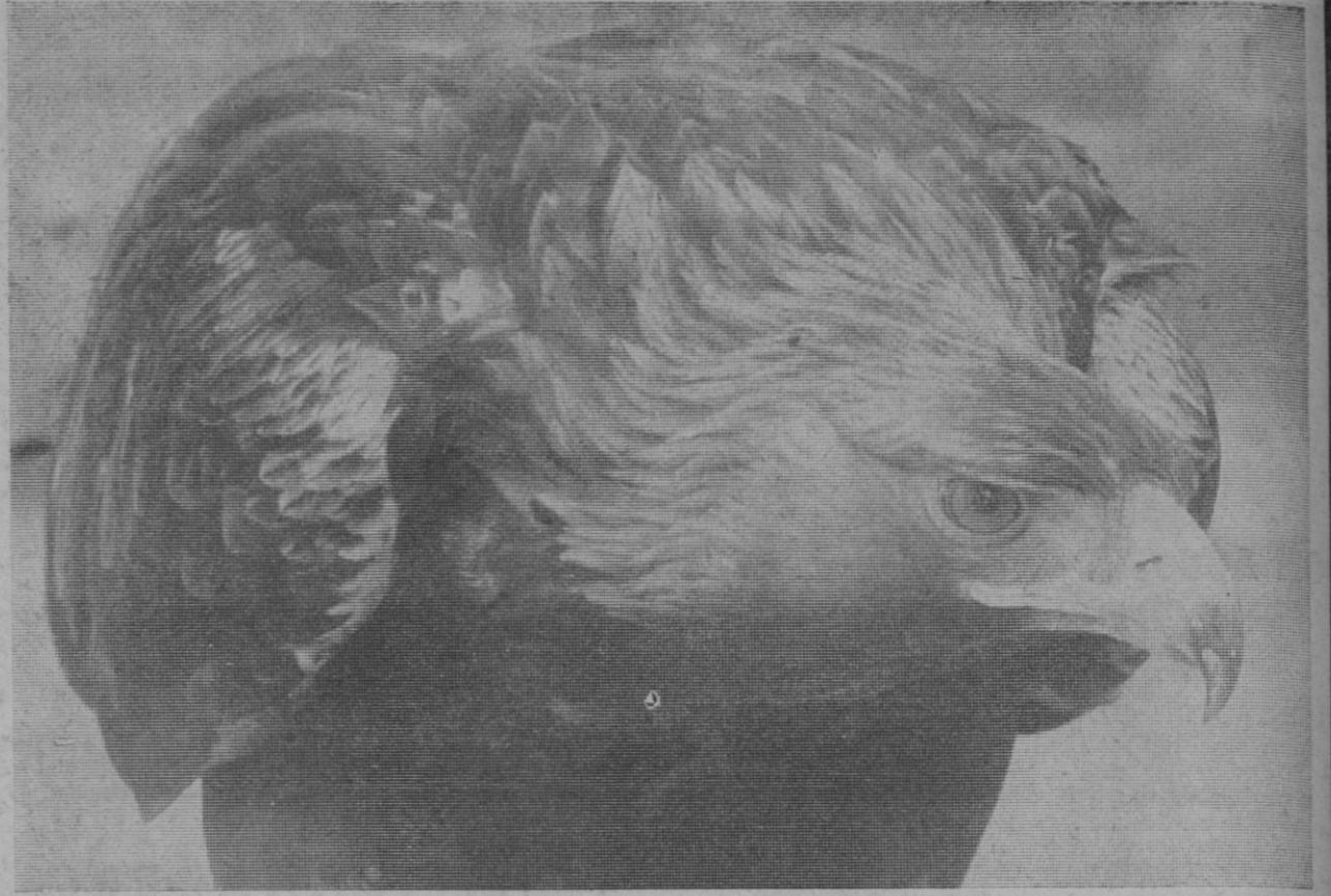
MAGNÍFICA ÁGUILA REAL, QUE SIGUE NIDIFICANDO AL