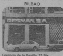
Gregorio de la Revilla, 25 Bis. Telefono 43 92 87/8/9