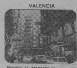
Moratin, 11, despacho 21. Telefono 22 34 65