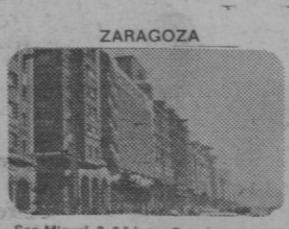
San Miguel, 2, 2.º Letra D. Telefono 23 22 58