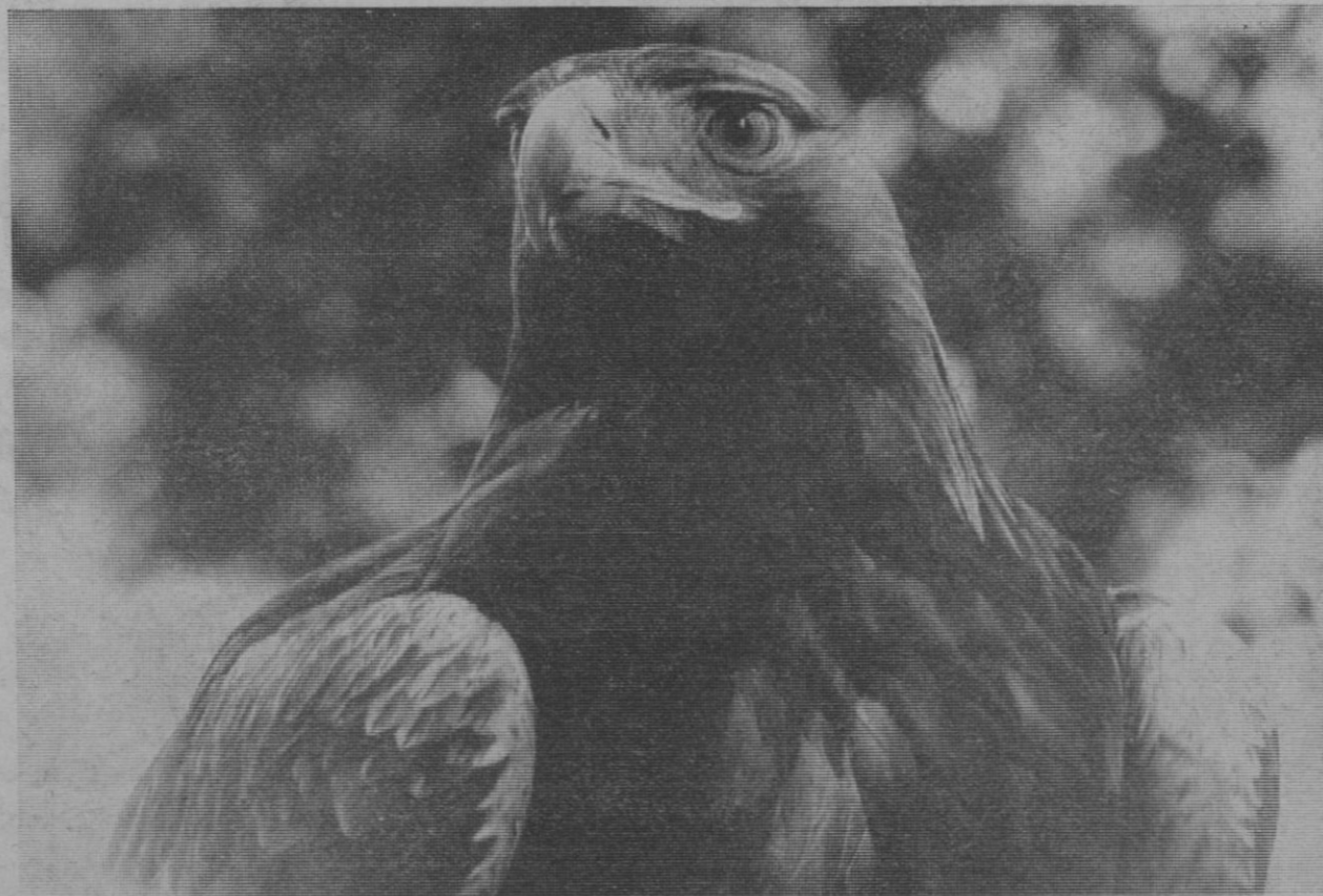
OTRO BELLO EJEMPLAR DE ÁGUILA REAL, ESPECIE EXPUESTA, COMO TANTAS OTRAS DE LAS AVES DEPREDADORAS, A LA DESAPARICIÓN Y EL EXTERMINIO