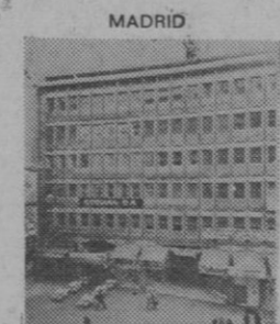
Montera, 24, 2.º B. Telefonos 2219360 2229167-2214379