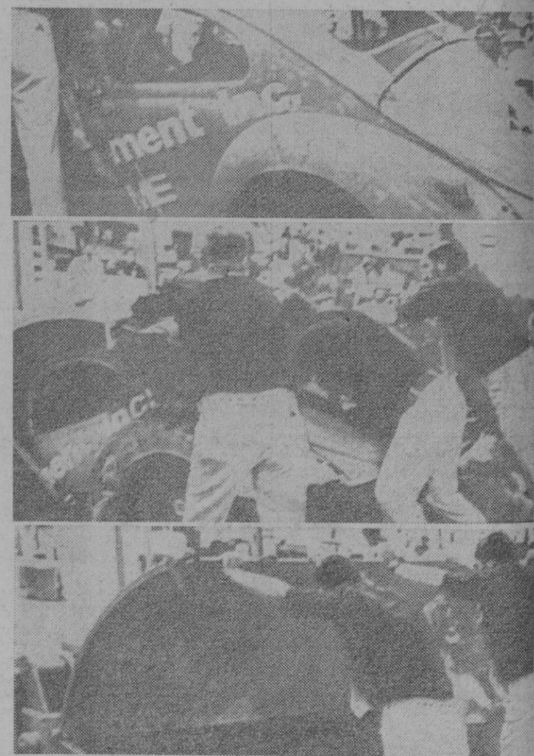
En las proximidades de las doradas playas de Miami, mientras las damas se tostaban al sol enfundadas (?) en sus bikinis, se ha presentado una poderosa máquina para la destrucción mecánica. La prueba se hizo con un viejo coche. Se le acercó a la enorme «bocaza» (foto primera), se le empujó un poco (foto segunda) y ¡zas!, desapareció como por arte de encanto (foto tercera). Se nos ocurre pensar que algo así hace falta en Segovia... para que desaparezcan los vertederos de basuras.