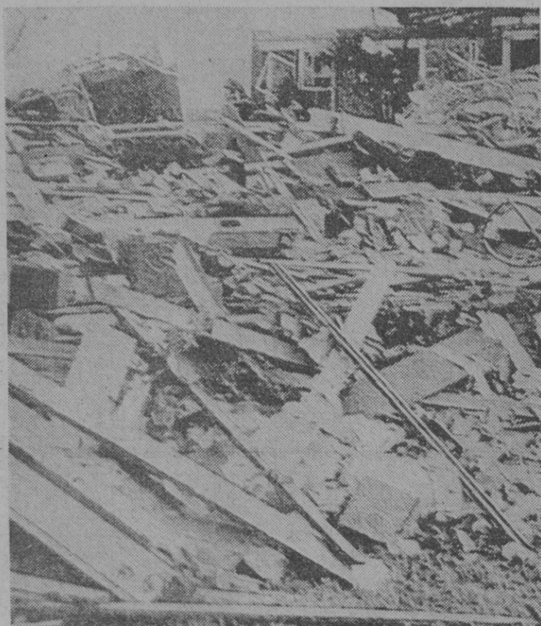
Una ciudad del estado de Oklahoma, de nombre Keefton, ha desaparecido prácticamente al verse azotada por un violento tornado. Tres personas, de una misma familia, muertas, y dieciséis más sufrieron heridas de diversa importancia. En la fotografía, un aspecto del desolador resultado de la violencia del fenómeno atmosférico