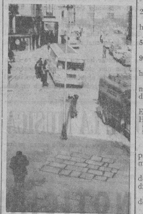
Hace días que desaparecieron los tablones que habían "acotado" el lugar destinado, en principio, para el célebre kiosco de la avenida de Fernández Ladreda. Ello ha permitido observar —como quizá pueda apre-

Los jubilados o retirados que perciban sus emolumentos o haberes a través de Bancos o Caja de Ahorros y Monte de Piedad, podrán hacerles efectivos a partir del día 2 del próximo mes de abril.