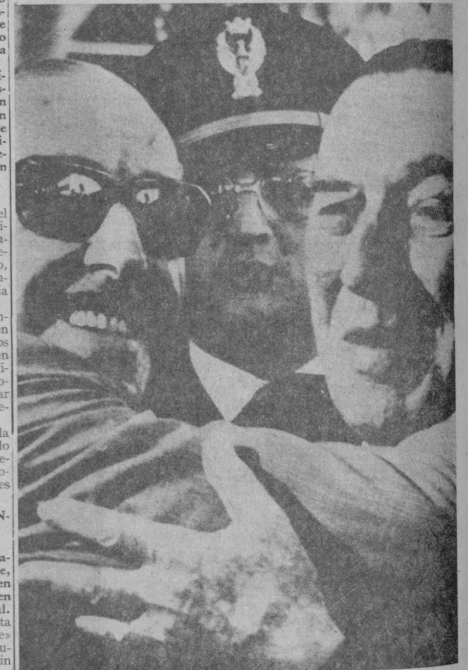
El aeropuerto internacional de Roma ha sido testigo del reencuentro Perón-Cámpora, que se abrazan efusivamente

Roma, 26.—El Presidente electo de Argentina, Héctor J. Cámpora, ha llegado a Roma, en las primeras horas de esta tarde, procedente de Buenos Aires.