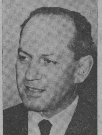
Milos Minic, nuevo ministro de Asuntos Exteriores de Yugoslavia, puesto en el que sucede a Mirko Tepavac

A juicio de los observadores las orientaciones adoptadas hoy por los representantes permanentes permiten en efecto suponer que mañana podrá muy probablemente anunciarse un acuerdo entre las dos partes sobre el protocolo adicional al actual Acuerdo España-C.E.E. que prorrogará este Acuerdo por un año acomodándolo a la Comunidad a «nuevos».—Efe.