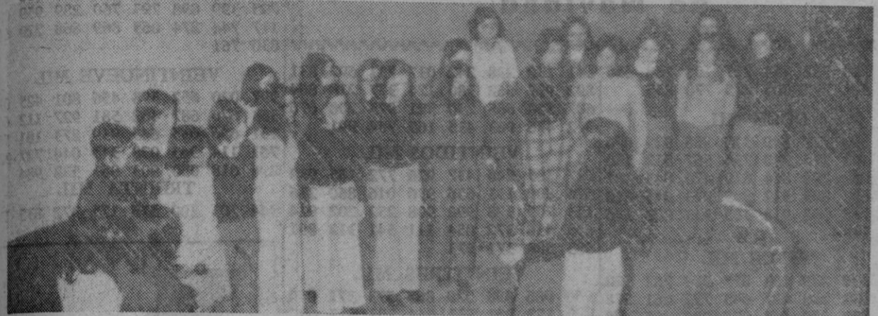
Los coros de la Residencia Provincial vencedores en el Concurso de Villancicos: Arriba el de categoría A y abajo el de la categoría B

Ayer se celebró en el teatro Juan Bravo la fase final del Concurso Provincial de Villancicos, que organizan las delegaciones provinciales de Sección Femenina y Juventud, con la coordinación de la Delegación Provincial de Cultura y la colaboración de Jefatura Provincial del Movimiento, Delegación Provincial de Información y Turismo y Caja de Ahorros y Monte de Piedad. En los grupos intervinieron 12 en la categoría «A» de niños y niñas hasta 14 años, y 5 en la Categoría «B», hasta 21 años. Todos ellos interpretando un villancico obligado y otro de libre elección. Actuaron en primer lugar, los coros de la categoría «A» integrados por los siguientes grupos: Escuela comarcal graduada de ni-