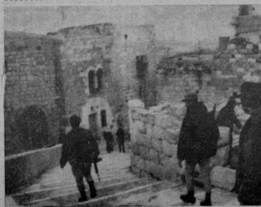
Un grupo de soldados israelíes patrulla una de las estrechas calles de Belén como medida de precaución ante las celebraciones de la Navidad.