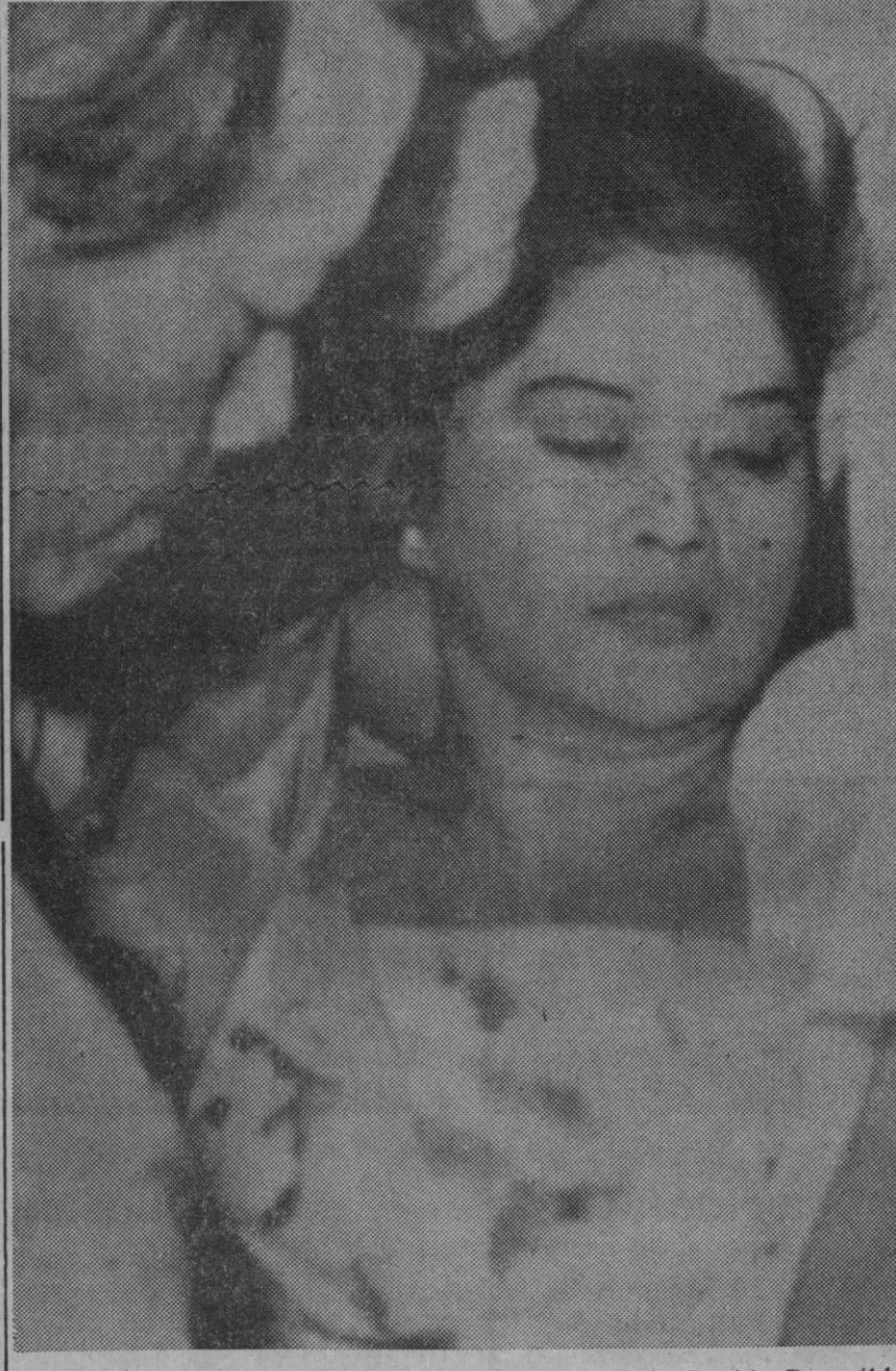
Mientras la esposa del Presidente de Filipinas, doña Imelda Romualdez de Marcos, asistía a una ceremonia de entrega de premios en Manila, un desconocido se lanzó sobre ella con un cuchillo y logró herirla en el pecho, un brazo y una mano. El agresor fue muerto a tiros por la Policía. Y la señora De Marcos fue trasladada exánime en un helicóptero a un hospital. Según las últimas informaciones, se encuentra fuera de peligro. El atentado tuvo lugar ante centenares de personas y las cámaras de televisión. En la fotografía, la señora De Marcos con el traje ensangrentado inmediatamente después de producirse el atentado.

Al parecer, los ocupantes del vehículo hubieron por el monte, y la Guardia Civil, que está dando batidas por el citado lugar, ha encontrado un «anorak» quemado.