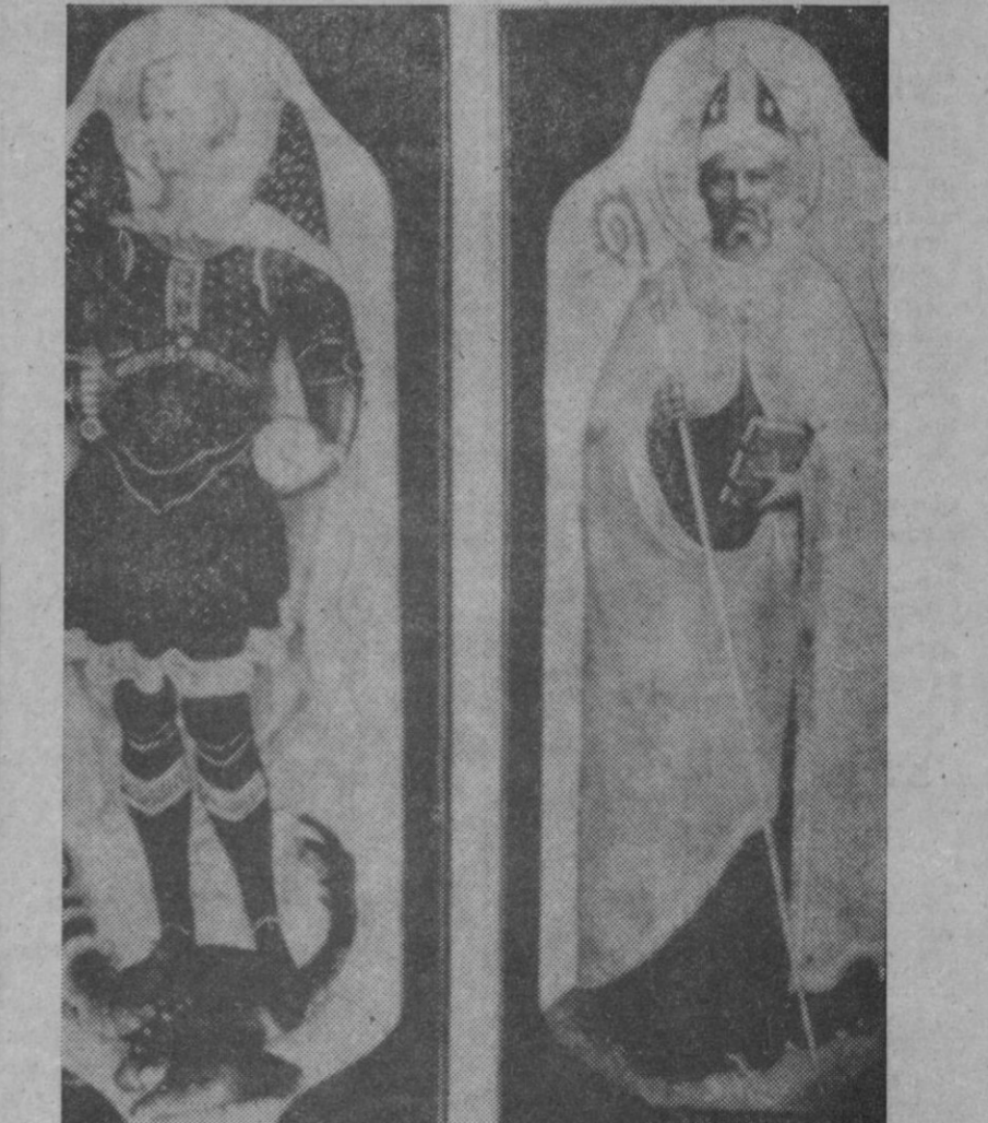
Subasta en la Galería Sothebys, de Londres, una de las más famosas en el mundo mercantil del arte. Estas tablas de Fra Angélico, que eran parte del retablo de una iglesia de Fiésole, cerca de Florencia, alcanzaron en la puja una cantidad superior a los treinta y cuatro millones de pesetas

«Sólo estudiando el viaje colombiano —dijo entonces el piloto norteamericano, hoy en vuelo hacia la Luna— y comparándolo con los nuestros interplanetarios, puede darse un cuenta del heroísmo, la fe y el valor de aquellos marineros españoles que salieron de aquí.—Cifra.