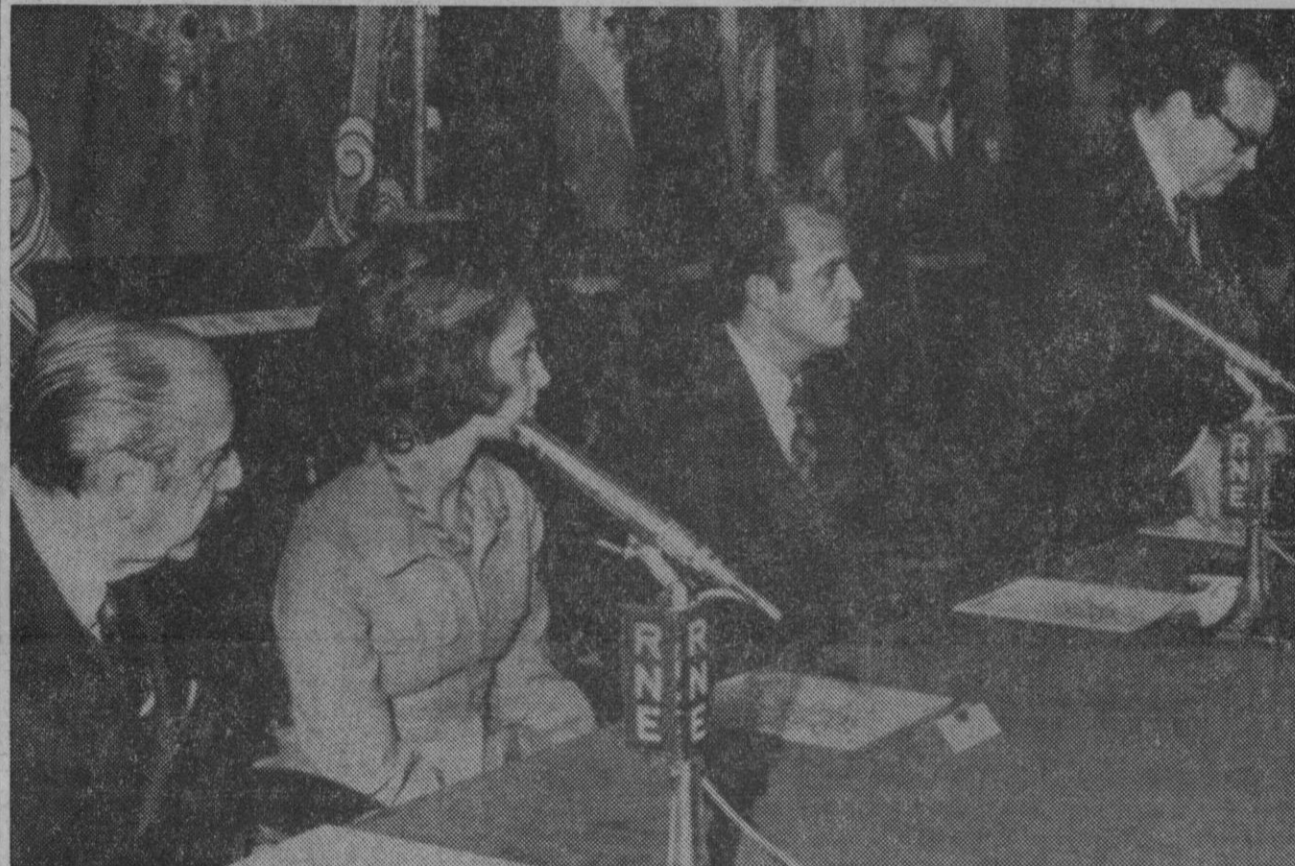
Los Príncipes de España, don Juan Carlos de Borbón y doña Sofía, inauguraron en la tarde de ayer el nuevo centro de Producción de Programas de Radio Nacional de España, en Prado del Rey, y, a continuación, la Exposición Internacional «Artetur 72» y la I Feria Internacional del Libro, en el Palacio de Cristal de la Feria del Campo. Sobre estas líneas, el ministro de Información y Turismo pronuncia el discurso inaugural de «Artetur 72».

Scotland Yard ha declinado confirmar o desmentir la información. Heinemann llegará a Gran Bretaña en visita de tres días el próximo martes. El grupo guerrillero eligió, dice el «Daily Mirror», al presidente de la República Federal Alemana, de 73 años, «para vengarse de la muerte de cuatro árabes, muertos en la matanza de Munich...».—Efe-Upi.