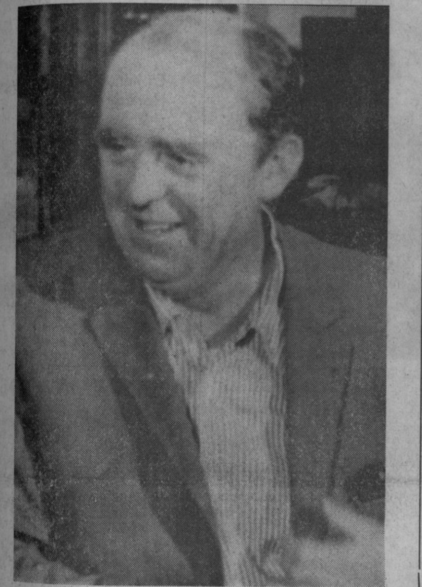
Atenas.—Henrich Böll, de 55 años, durante su conferencia de prensa dada en Atenas después de haberle sido comunicada la concesión del Premio Nobel de Literatura. Böll es el primer novelista alemán que gana el Nobel desde Thomas Mann, hace 46 años.

El primer premio está dotado con 125.000 pesos (640.000 pesetas) el segundo con 62.500 pesos (320.000 pesetas) y el tercero con un piano de cola.—Efe.