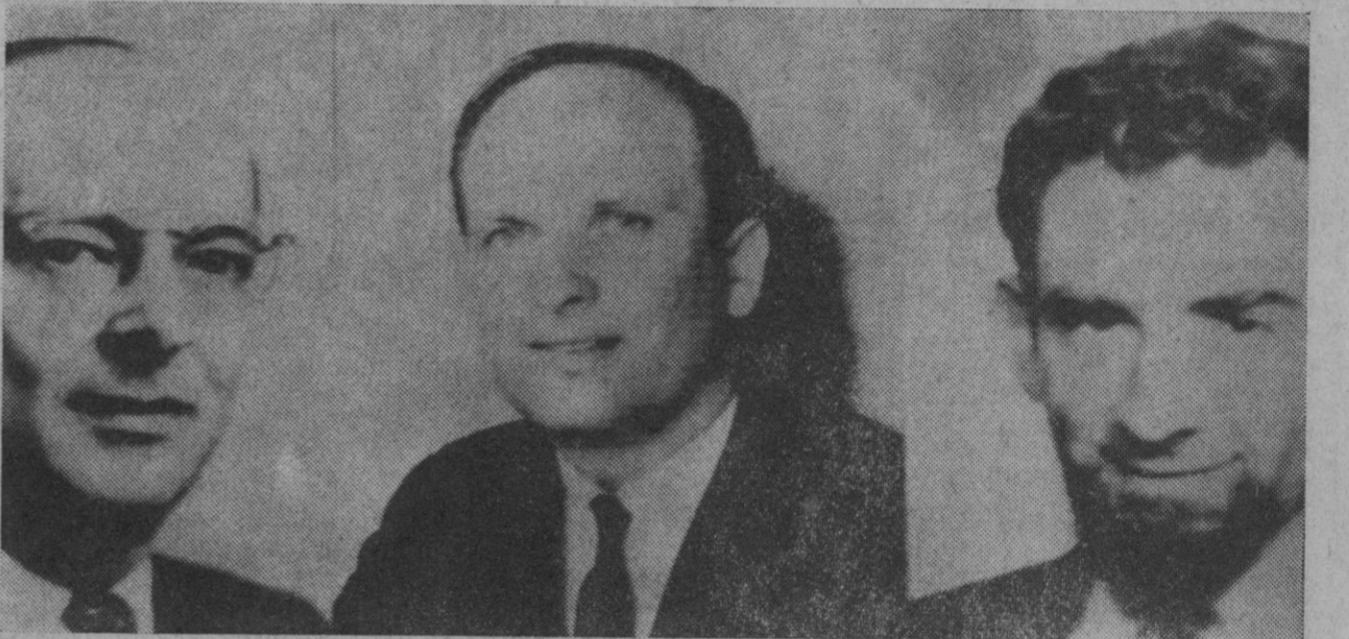
Estocolmo.—Foto composición de los tres profesores galardonados con el Premio Nobel de Física. Son John Bardeen, de la Universidad de Illinois; John Schrieffer, de la de Pensilvania, y León Cooper de la de Rhode Island.

Otra decisión que permite hablar de éxito de la «cumbre» es la de englobar dentro de la competencia comunitaria a los nuevos sectores en los que los «nueve» van a concentrar lo más importante de sus actividades, acogiéndose para ello jurídicamente al artículo 235 del tratado de Roma, que deja abierta tal posibilidad.