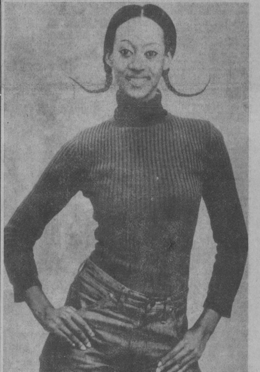
Esta es la Princesa Isabel de Toro, consejera del Presidente Amin de Uganda. Ella ha dejado su carrera de actriz y modelo. A sus 28 años puede, según dicen, cambiar las cosas en Uganda. Es la mejor embajadora de Amin en el extranjero, y sus palabras tienen más peso que las de cinco esposas de Amin. Cuando éste prohibió las minifaldas, ella llevó la más corta de todas. Su padre fue el rey George Rukiidi III, de Toro, estado independiente hasta que, en 1967, formó la República de Uganda con otros dos países.—(Telefoto Europa Press)

bre el cristal de una ventana. Me di cuenta que en una fotografía no se distinguiría si la mosca estaba en el cristal o en el aire y un poco borrosa parecería un platillo volante. Birch fue más lejos y fotografió tres moscas que se convirtieron en una formación de platillos, utilizados posteriormente como prueba documental de su existencia.—Efe.