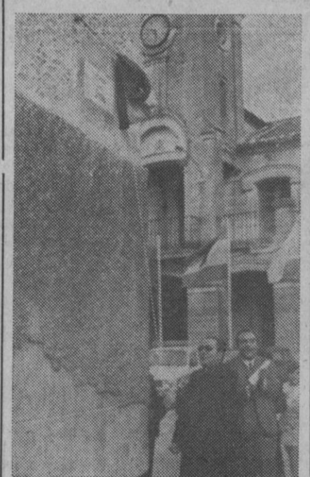
El obispo de la diócesis procediendo a descubrir la placa que da el nombre del Sínodo a una plaza de Aguilafuente.

Después de extenderse en otras consideraciones sobre la importancia del Sínodo de Aguilafuente, el alcalde agradeció la presencia en la villa de las ilustres personalidades que asistían a los actos.