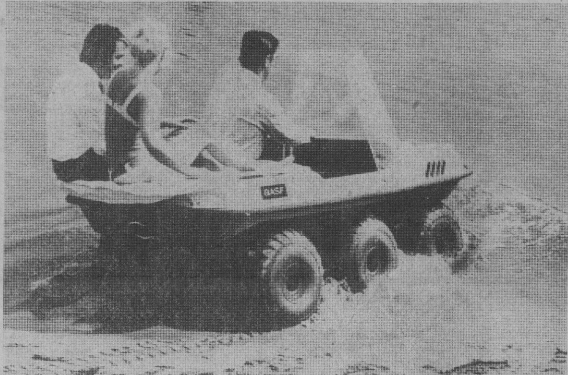
Esto es más que un «todo terreno», porque, además, también puede «rodar» sobre el agua. Para él, no importan arenales, barrizales, nieve, pendientes, zonas pedregosas o ríos que atravesar en su camino. Fabricado en Alemania, bautizado «Argo».