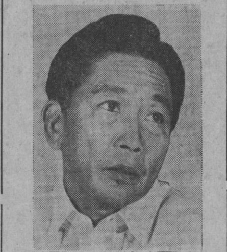
Fernando Marcos, Presidente de Filipinas, que ha proclamado la ley marcial y ordenado depurar al país de "funcionarios incompetentes y corrompidos"

La operación de seguridad comenzó hoy ante el miedo de que los terroristas de "Septiembre Negro" intenten dar un golpe en Londres para forzar la puesta en libertad de los tres guerrilleros en poder de los alemanes después de la matanza en los Juegos Olímpicos de Munich.