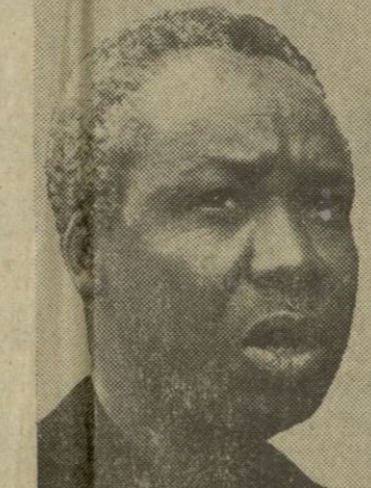
Julius Nyerere, Presidente de Tanzania, que trata de evitar la crisis que amenaza estallar entre su país y el vecino Uganda

Moscú, 2.—La agencia oficial soviética "Tass" comunica hoy que el 30 de septiembre fue lanzado en la Unión Soviética un satélite de comunicaciones, "Molnia 2", que servirá para establecer contactos telefónicos y de telegrafía así como para transmitir el programa de la televisión soviética. A bordo se encuentran, además de aparatos para la transmisión telefónica y telegráfica, un sistema de orientación y corrección de la órbita, para el suministro de energía y aparatos de dirección y medida. Los parámetros del satélite son los siguientes: —Apogeo en el hemisferio Norte, 39.200 kilómetros. —Perigeo en el hemisferio Sur, 480 kilómetros. —Angulo de inclinación orbital: 65,3 grados. —Recorrido: 11 hor. 43 min.—Efe.