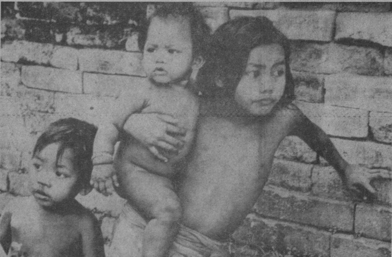
«Una vida mejor para los niños de los barrios de tugurios y de viviendas improvisadas» es el lema que hoy preside el Día Universal del Niño, que se celebra en un centenar de países y cuyo objetivo es el de reforzar el sentimiento de solidaridad internacional en pro del bienestar de la infancia.

Según ha trascendido oficialmente—añade dicha agencia—, la reforma afectaría de modo especial a los capítulos VII, VIII y IX de dicho Reglamento, que se refieren, en especial, a las secciones y Ponencias, al procedimiento (que incluye sugerencias al Gobierno y contraste de pareceres sobre la acción política) y al Pleno del Consejo, etc.