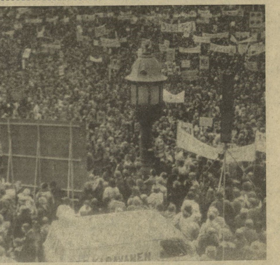
Copenhague.—Más de 75.000 personas en Copenhague (según cálculos de la policía) se reunieron frente a la plaza del Ayuntamiento de la ciudad para manifestar su desacuerdo con la integración con Europa.

Madrid, 2.—Quince muertos y 21 heridos graves es el balance de los catorce accidentes registrados en las carreteras españolas durante el pasado fin de semana, según datos provisionales facilitados por la Jefatura Central de Tráfico. El sábado, día 30 de septiembre, hubo seis accidentes que ocasionaron igual número de muertos y siete heridos graves. El domingo día 1 de octubre, hubo ocho accidentes con nueve muertos y catorce heridos graves.—Cifra.