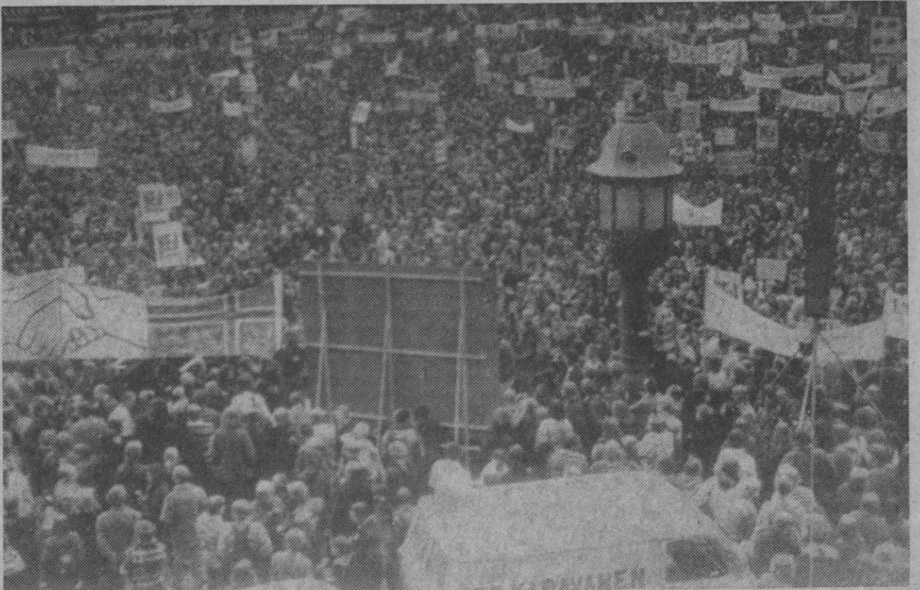
Copenhague.—Más de 75.000 personas en Copenhague (según cálculos de la policía) se reunieron frente a la plaza del Ayuntamiento de la ciudad para manifestar su desacuerdo con la integración con Europa.

Madrid, 2.—Quince muertos y 21 heridos graves es el balance de los catorce accidentes registrados en las carreteras españolas durante el pasado fin de semana, según datos provisionales facilitados por la Jefatura Central de Tráfico. El sábado, día 30 de septiembre, hubo seis accidentes que ocasionaron igual número de muertes y siete heridos graves. El domingo día 1 de octubre, hubo ocho accidentes con nueve muertos y catorce heridos graves.—Cifra.