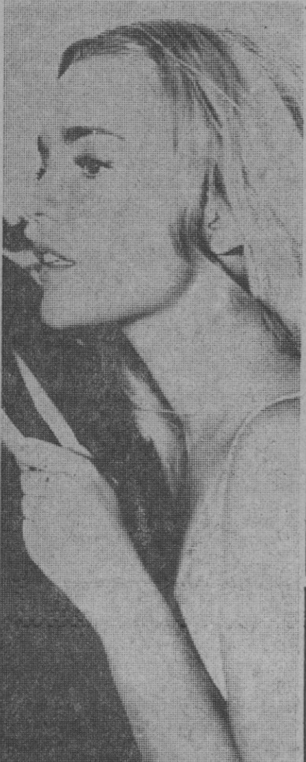
Se llama Tuesday Wed. Una actriz que hay que tomar en serio. En el último Festival de Cine de Venecia la concedieron el premio a la mejor actriz, merecido por su película «Play it as it lays», que descubre las tristes vidas de algunos actores. Tiene 29 años, aunque no lo parezca, y ya trabajaba en el cine desde los 14 años.