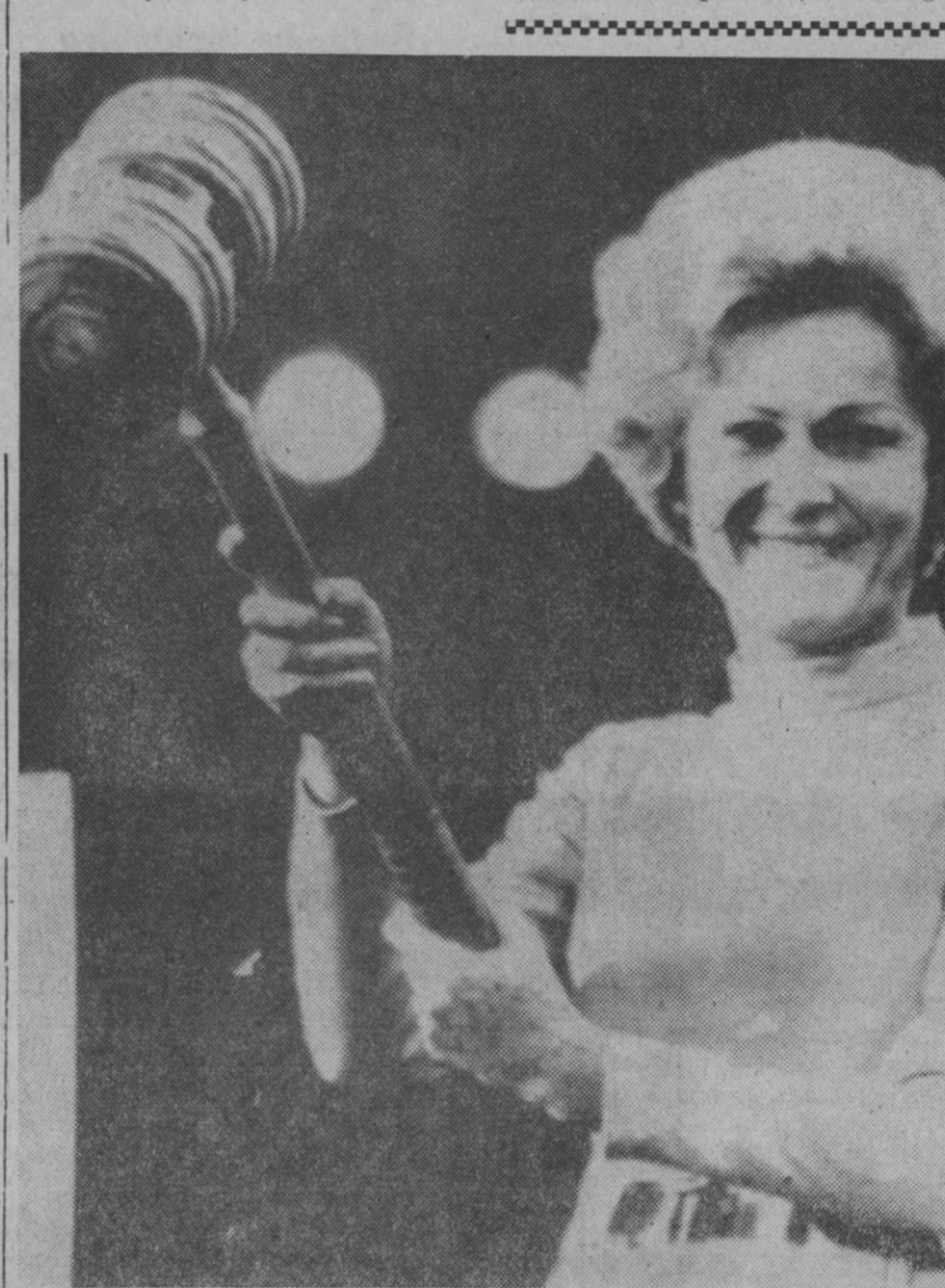
La señora Patricia Nixon, esposa del presidente de los Estados Unidos, alza el mazo para declarar abierta la convención republicana, que se celebra en la ciudad de Miami Beach (Florida), anteriormente escenario de la convención demócrata. La esposa de Nixon, segura de la candidatura de su marido, rompió todas las tradiciones al aparecer personalmente en la tribuna de la convención, acompañada de sus hijos Julie y David Eisenhower y de Tricia y Edward Cox. En el pasado, ninguna esposa de un presidente ha pisado el suelo de la convención hasta que era firme el nombramiento de candidato.

El presidente después de besar a su esposa, Pat, y a sus hijos Tricia y Julie, que acudieron a darle la bienvenida al aeropuerto, marchó en helicóptero hasta su cercana residencia de Key Biscayne.