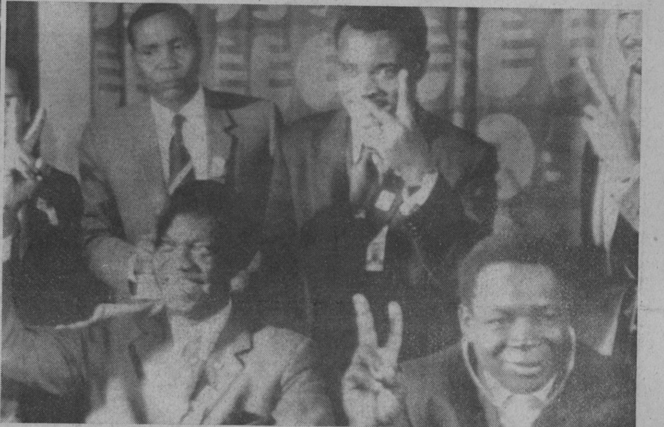
Munich.—Miembros del Consejo Supremo del Deporte Africano forman la V de victoria después de conocer la decisión del Comité Olímpico Internacional de negar la participación en los Juegos a los miembros del equipo rodesiano.

primer trimestre del presente año. Forman parte del mismo la compañía francesa Elf-Erap, que actúa como operadora, con una participación del 32 por 100 en el permiso, la Agip, con el 28 por 100, Hispanoil, con el 20 por 100, Petrofina con el 15 por 100 y la empresa estatal austriaca OMM. V., con el 5 por 100.—Cifra.