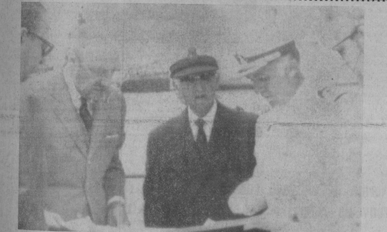
La Coruña.—El Caudillo, acompañado del ministro del Ejército, jefes de sus Casas Civil y Militar y comandante del yate "Azor" estudian sobre la cubierta de la nave la zona de lanzamiento de paracaidistas en la bahía coruñesa.