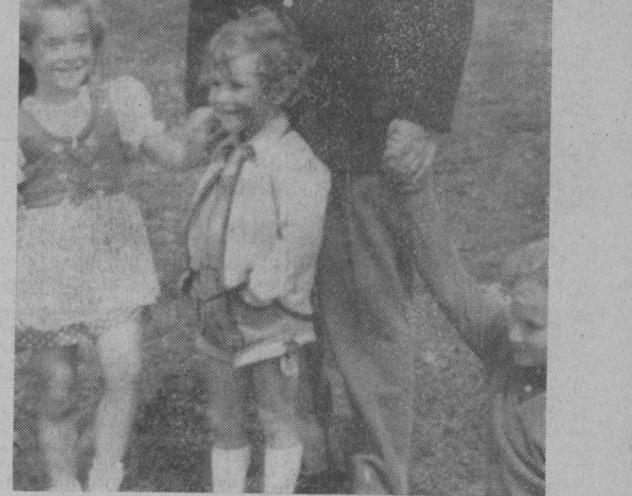
Laax (Suiza).—El consejero personal del presidente Nixon ha estado en Suiza con motivo de las bodas de oro de sus padres. Kissinger aparece acompañado de sus hijos durante una excursión de montaña.

El rey Hassan II se reunirá en un almuerzo con el ministro español de Asuntos Exteriores, estando prevista su salida de Barcelona a las cuatro de la tarde, por vía aérea.—Cifra.