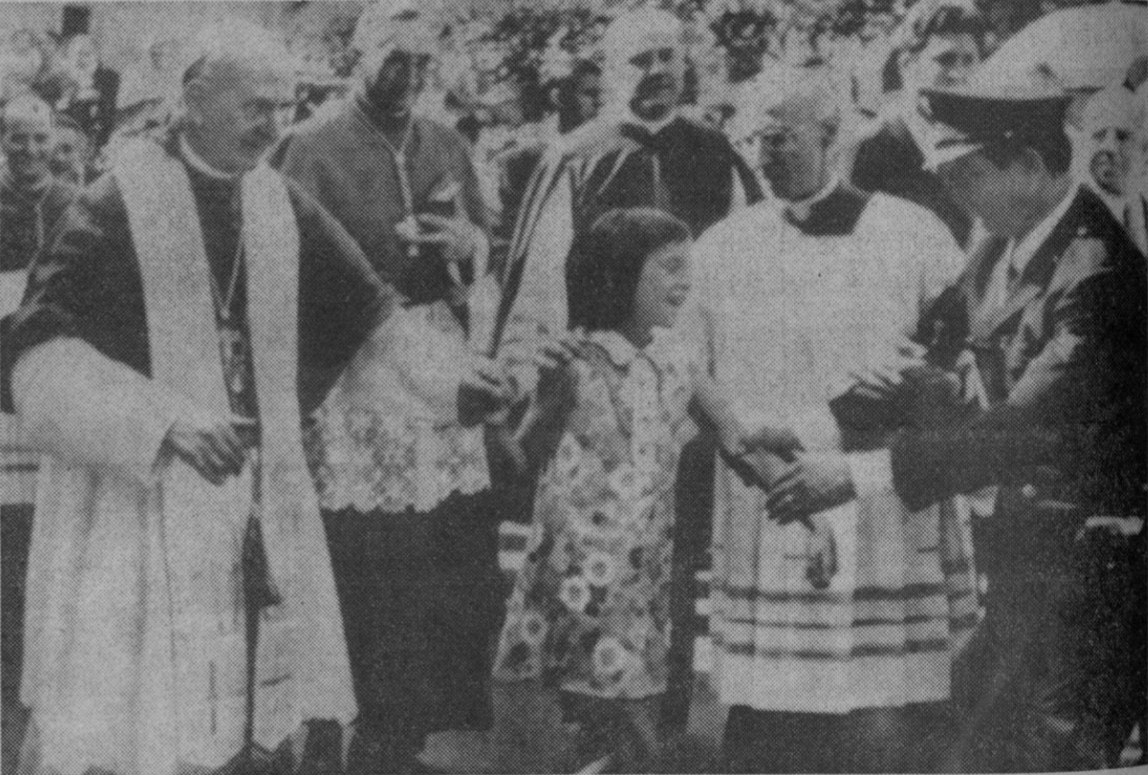
Cuando Pablo VI regresaba a su residencia de Castelgandolfo, tras haber celebrado misa en la parroquia de Santo Tomás, con motivo de la festividad de la Asunción, esta pequeña, salvando la vigilancia del policía, se le acercó para andar un trecho de su mano. Su inocente gesto contrasta con el del agente. El simpático incidente provocó la sonrisa de acompañantes y espectadores.