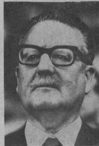
Salvador Allende, Presidente de Chile, otra vez en dificultades por la crisis gubernamental en el país

Según los mismos organizadores, habrá control «antidoping» para los burros y para quienes los monten y también guapas señorías para dar el beso de vencedor al burro si el jinete es feo, y al revés.