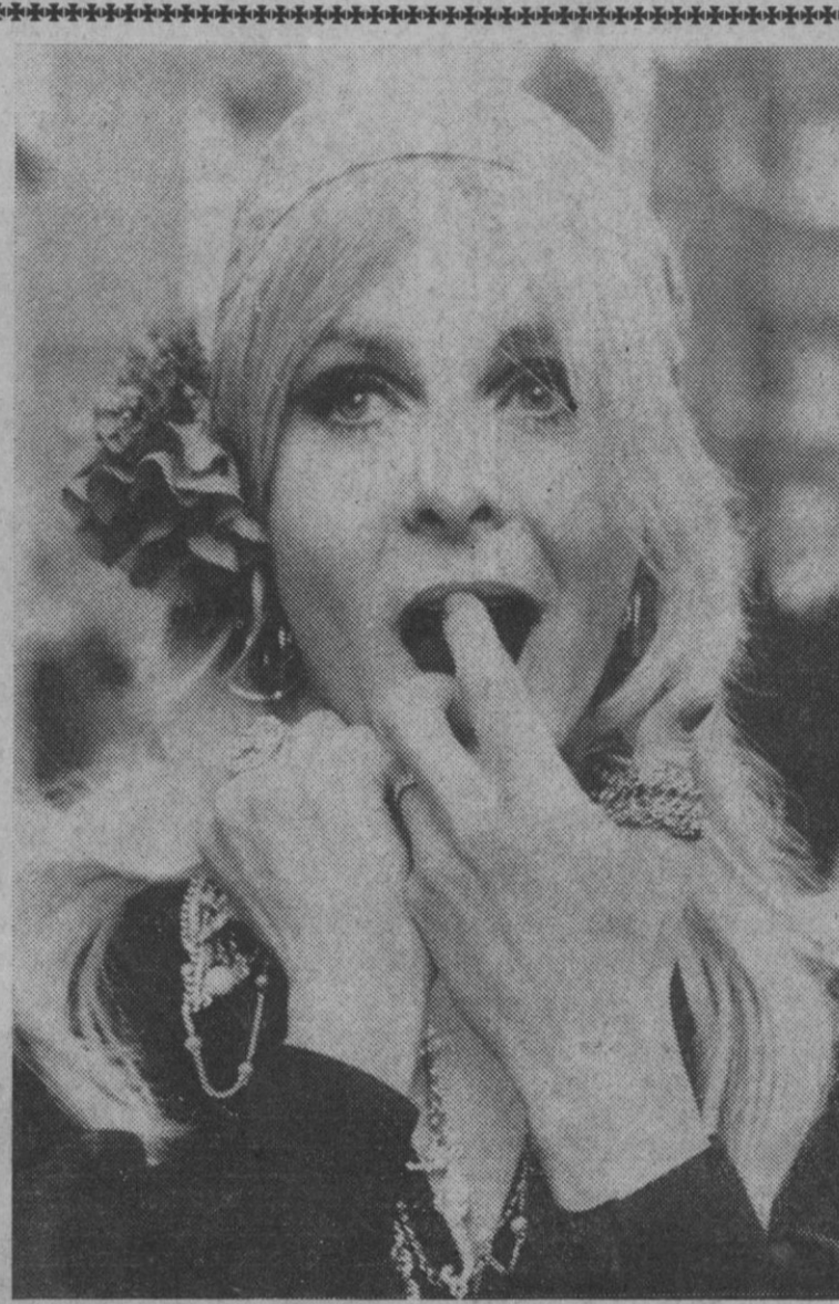
June Ritchie. Una Scarlet O'Hara que canta, como estrella que es del musical «Lo que el viento se llevó». En el escenario del Teatro Drury Lane, de Londres, donde cosecha buenos triunfos. Hace once años comenzó su carrera de actriz. Pensaba retirarse cuando la ofrecieron este papel en el mencionado musical.

Según informes al menos 71 personas han resultado muertas y varios centenares heridas.—Efe-Upi.