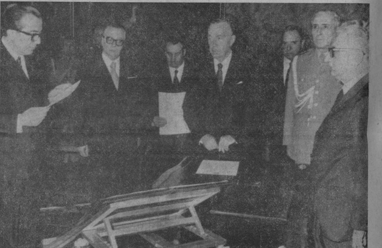
Roma.—El premier del partido cristiano demócrata, Giulio Andreotti durante la jura del cargo ante el presidente italiano, Giovanni Leone en el palacio del Quirinal.—(Telefoto AP - Europa Press)

El nuevo cambio queda establecido en 63,4980 pesetas el dólar comprador y 63,6580 pesetas el dólar vendedor.—Cifra.