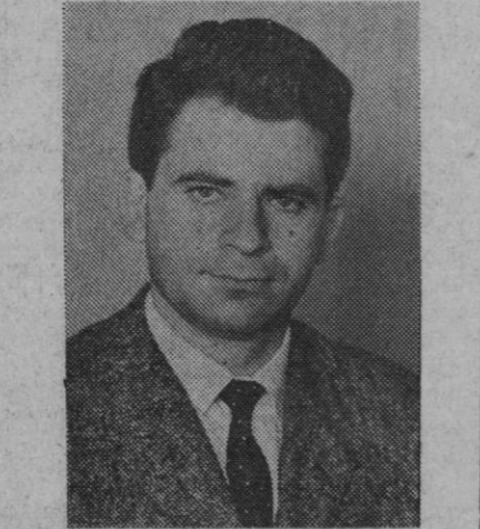
Boris Spassky, jugador soviético de ajedrez, campeón del mundo, que deberá defender su título frente al americano Robert Fischer, el próximo domingo, día 2 de julio, en Reykjavik (Islandia)

En el caso de la Comunidad Europea creo que le interesa más ser