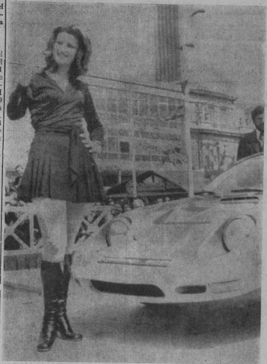
La foto nos muestra un momento del concurso «Desfile de Elegancia», celebrado en el Salón Internacional del Automóvil celebrado en Barcelona. Junto a la bella carrocería del «Condor-Arth», una muchacha no menos bella.

La votación ha sido un triunfo para los católicos neoyorquinos, que al frente de su cardenal, Terence Cook, habían llevado a cabo una campaña contra la legalización del aborto.—Efe.