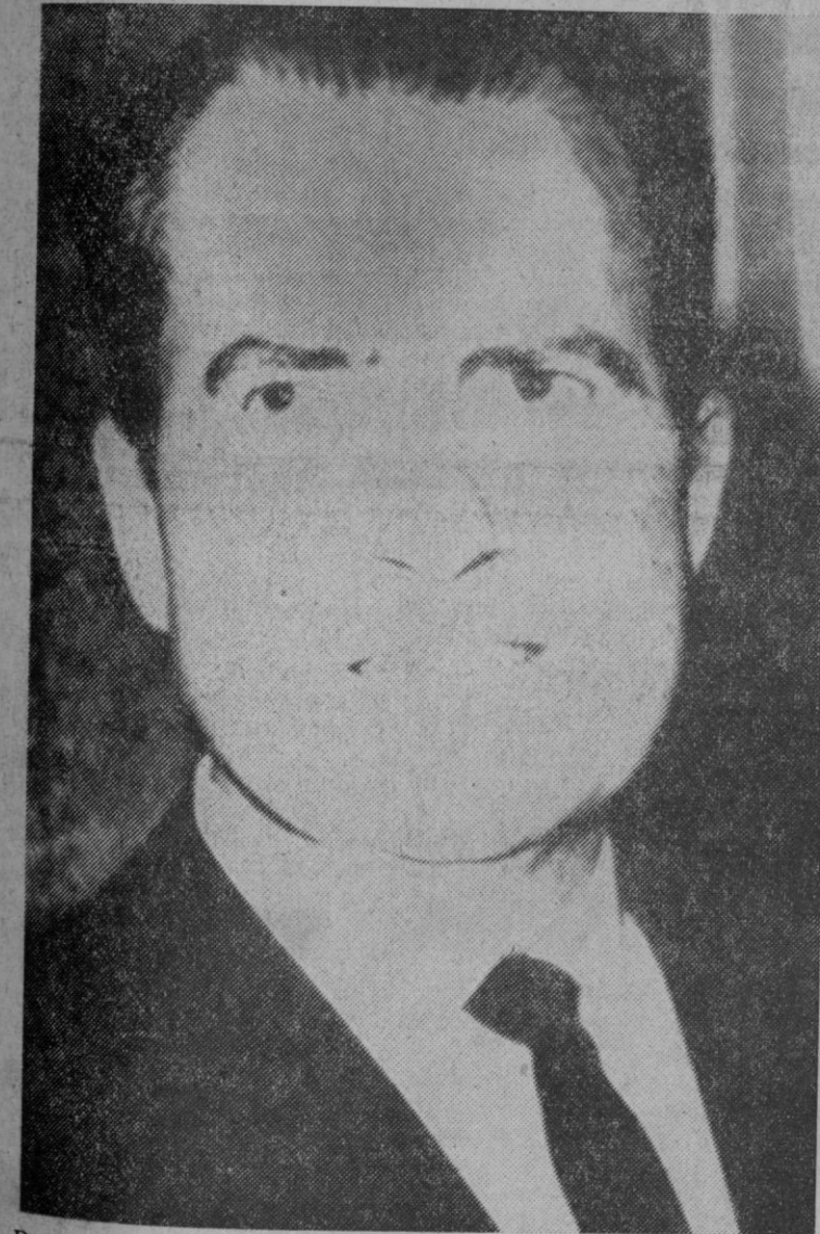
De excepcional puede calificarse la repercusión alcanzada en la prensa y la opinión pública mundiales por la decisión del presidente Nixon al anunciar el bloqueo de los puertos norvietnamitas.

Madrid, 11.—Se aprueba el III Plan de Desarrollo Económico y Social para el cuatrienio mil novecientos setenta y dos-mil novecientos setenta y cinco, por ley de la Jefatura del Estado que hoy inserta el «Boletín Oficial del Estado». El III Plan de Desarrollo Económico y Social, fue aprobado por las Cortes Españolas el pasado día 9 del mes en curso.—Cifra.