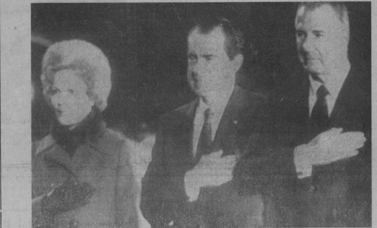
Base aérea de Andrews.—El matrimonio Nixon junto al vicepresidente, Spiro Agnew, escuchan con la mano sobre el corazón la interpretación del himno nacional.