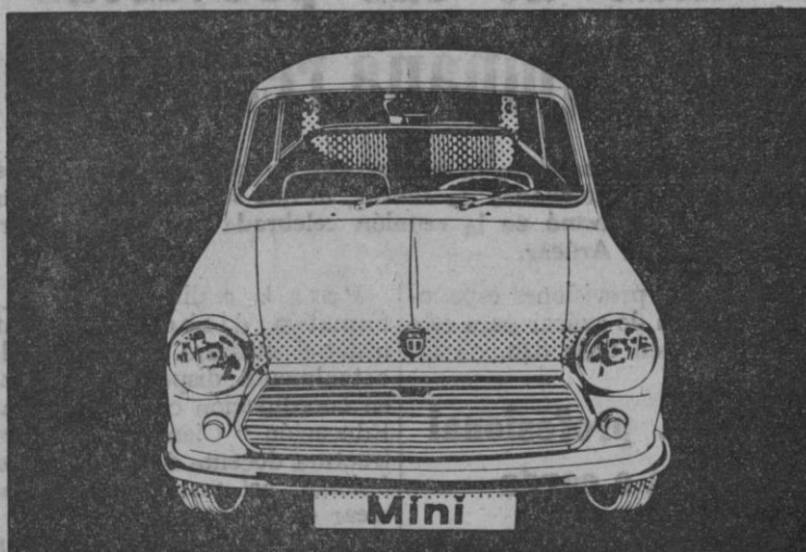
Elija entre los 5 modelos Mini (850, 850 de Luxe, 1000, 1000 de Luxe y 1275 GT) en: